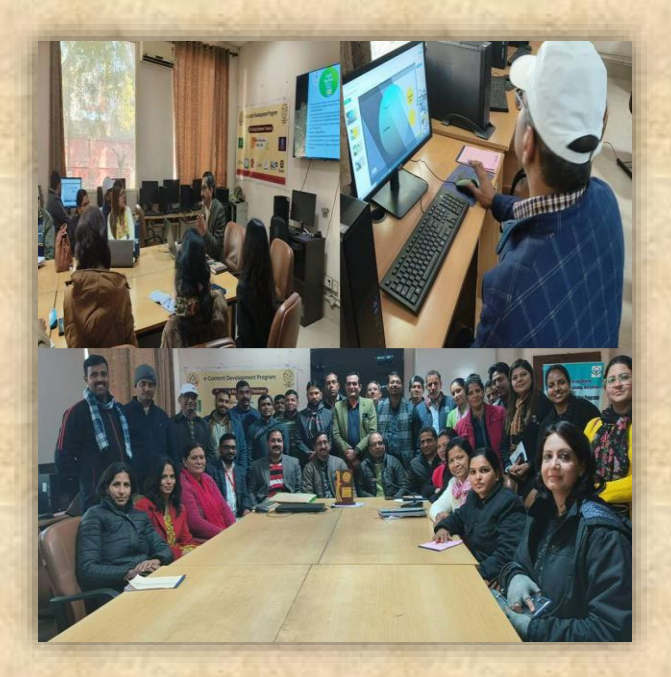
Batch 3 was started from 16th Jan to 20th Jan, 2023 and 30 Participants attended from 12 districts.