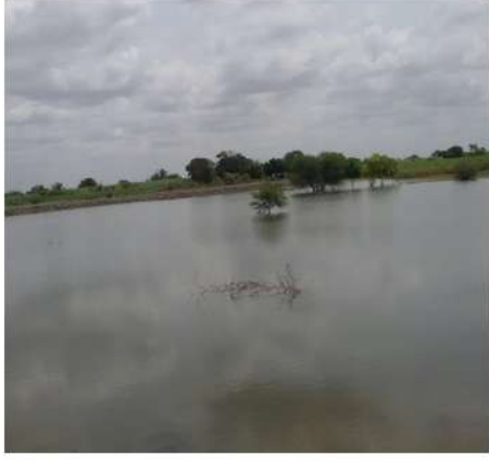
पाझर तलाव दुरूस्तीनंतर पाणीसाठा