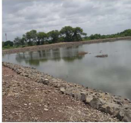
पाझर तलाव दुरूस्तीनंतर पाणीसाठा