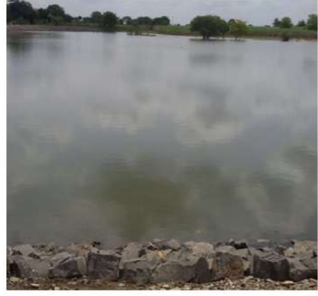
पाझर तलाव दुरूस्तीनंतर पाणीसाठा