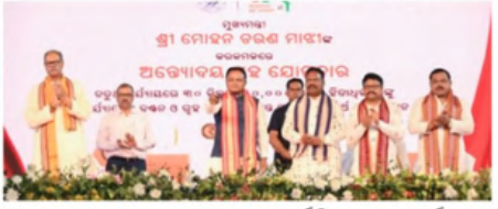
ଅତ୍ୟାଧୁନିକ ଗୃହ ଯୋଜନାରେ ୫୦ ହଜାରରୁ ଊର୍ଦ୍ଧ୍ୱ ହିରାଧିକାରୀଙ୍କୁ କାର୍ଯ୍ୟାଳୟ

■ ବଲାଙ୍ଗୀର, ୨୪୪ (ସମ୍ବିଧ): ବଲାଙ୍ଗୀରରେ ହେବ ଚିନି କଳ, ଟେକ୍ସଟାଇଲ୍ ପାର୍କ। ବଲାଙ୍ଗୀରଠାରେ ରାଜ୍ୟସ୍ତରୀୟ ଜାତୀୟ ପଞ୍ଚାୟତିରାଜ ସମ୍ମିଳନୀର ଫଳନ ବାଣୀକୃତମାନଙ୍କ ଘୋଷଣା ହେବ ଏହା ଘୋଷଣା କରିଛନ୍ତି ମୁଖ୍ୟମନ୍ତ୍ରୀ ନେତ୍ରମୋହନ ପାଣିଗ୍ରାହୀ । ଏହି ଅବସରରେ ଅତ୍ୟାଧୁନିକ ଗୃହ ଯୋଜନାରେ ୫୦ ହଜାର କାର୍ଯ୍ୟାଳୟକୁ ମଧ୍ୟ ମୁଖ୍ୟମନ୍ତ୍ରୀ ବାଣୀକୃତମାନଙ୍କ ଦେଖିବାକୁ ଦେଇଛନ୍ତି । ମୁଖ୍ୟମନ୍ତ୍ରୀ କହିଛନ୍ତି ଯେ ଜାତୀୟ ପଞ୍ଚାୟତିରାଜ ଦିବସ କେବଳ ଏକ ସମାବେଶ ନୁହେଁ, ଏହା ଗ୍ରାମାଞ୍ଚଳ ସ୍ୱ-ଶାସନ ଓ ଲୋକତନ୍ତ୍ରର ଗୋଟିଏ ଶକ୍ତିକୁ ଜାଗରଣ କରିବାର ଦିବସ। ୨୩ତମ ସମ୍ବିଧାନ ଏ-ଶ୍ରେଣୀର ଚିନି ଦଶକ ପରେ ପଞ୍ଚାୟତିରାଜ ବ୍ୟବସ୍ଥା ଏବଂ ଏକ ଗୁରୁତ୍ୱପୂର୍ଣ୍ଣ ସମୟ ହେବ ବୋଲି କହିଛନ୍ତି । ଲୋକଙ୍କ ସ୍ୱତ୍ୱ ଉଚ୍ଚାରଣ ଓ ଅଧିକତା ବିଚାରାଳୟ ଏହି ବ୍ୟବସ୍ଥାକୁ ଅଧିକ ଉତ୍ସାହ ଦେଖାଇ ଦେଖାଇବ । ପ୍ରଧାନମନ୍ତ୍ରୀ ନରେନ୍ଦ୍ର