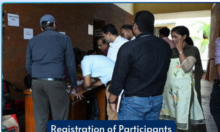
Registration of Participants