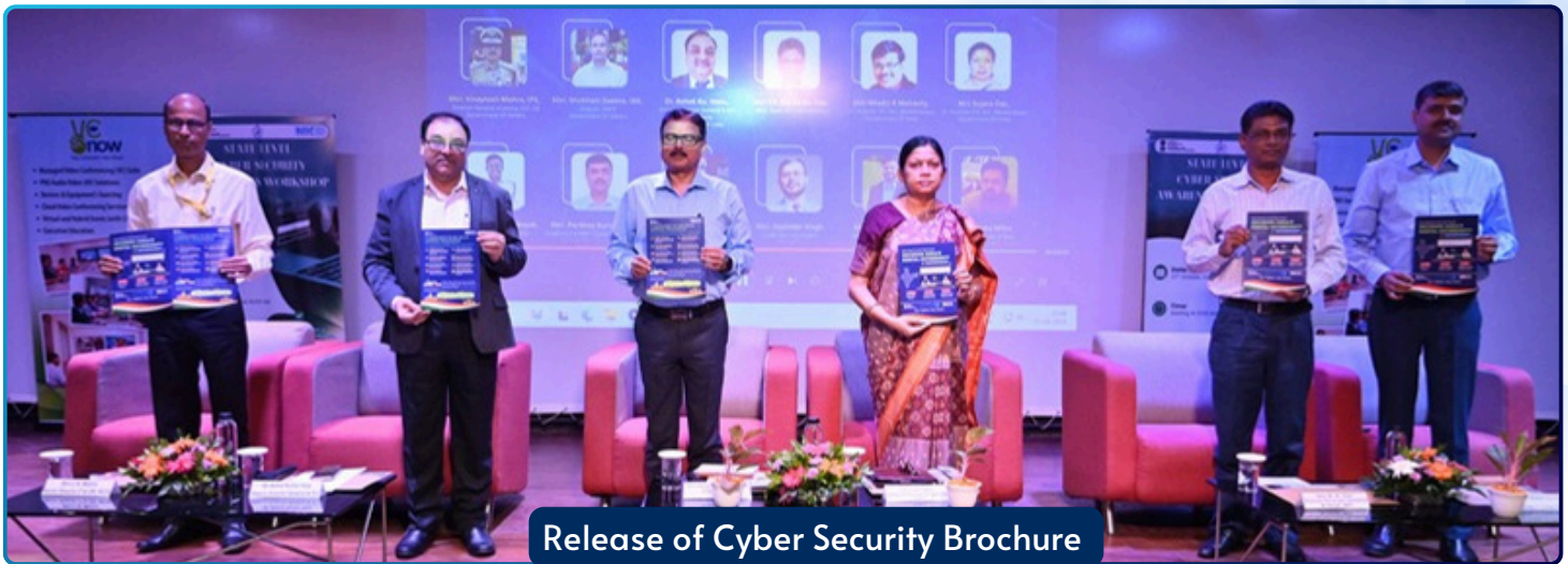
Release of Cyber Security Brochure