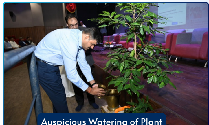
Auspicious Watering of Plant