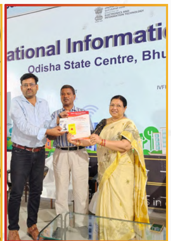
Participants receiving certificates and token of love