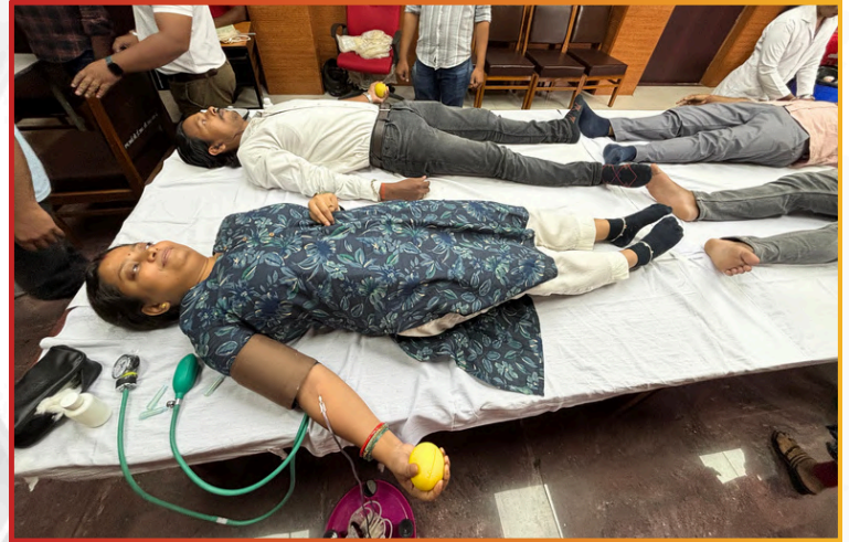
Employees registered to participate in the noble cause of blood donation