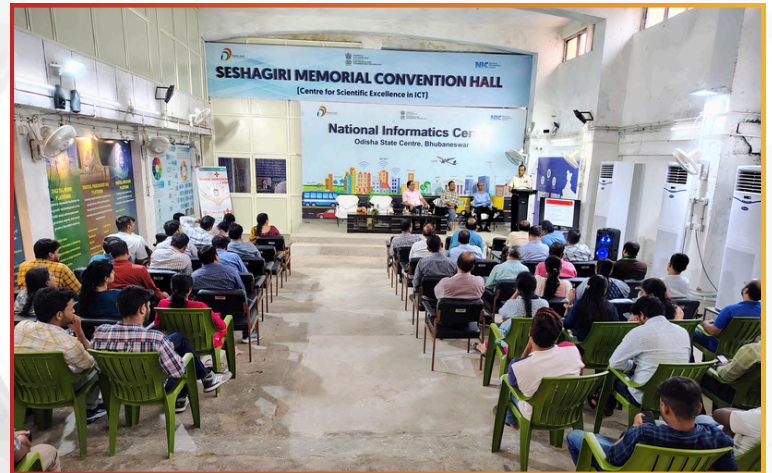
Informative Session on Blood Donation held at Seshagiri Memorial Hall on 14 th May 2025