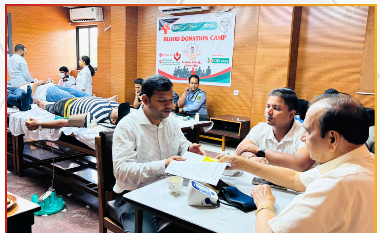
Employees registered to participate in the noble cause of blood donation