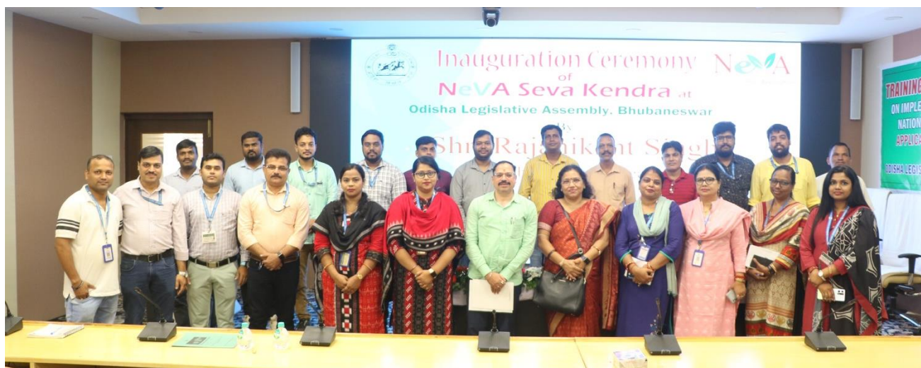
NeVA Team, Bhubaneswar, Odisha