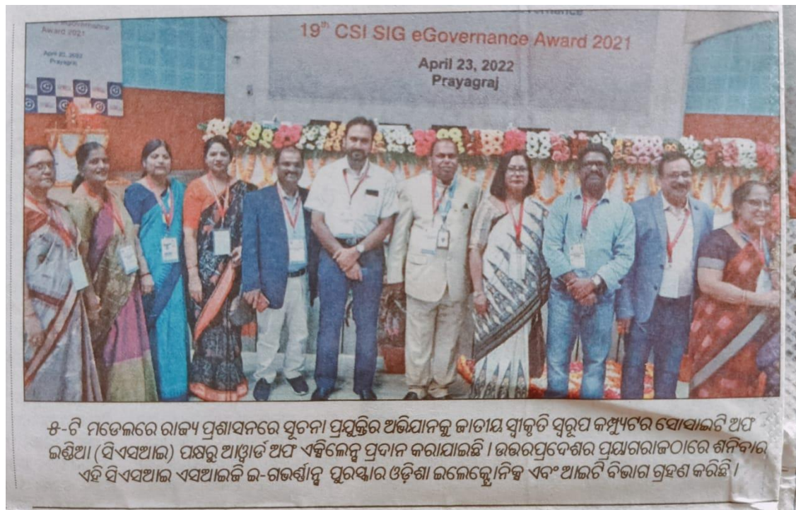
ଫଟୋ: ଗତକାଲି ରାଜ୍ୟ ପ୍ରଶାସନରେ ଯୁବନା ପ୍ରଯୁକ୍ତିର ଅଭିଯାନକୁ ଜାତୀୟ ସ୍ତରୀୟ ସ୍ୱରୂପ କମ୍ପ୍ୟୁଟର ସୋସାଇଟି ଅଫ ଇଣ୍ଡିଆ (ସିଏସଆଇ) ପକ୍ଷରୁ ଆୟୋଜିତ ଅଟେ ଏହି ଲେବର ପ୍ରଦାନ କରାଯାଇଛି । ଉତ୍ତରପ୍ରଦେଶର ପ୍ରୟାଗରାଜଠାରେ ଶିନିକାର ଏହି ସିଏସଆଇ ଏସଆଇଇ ଇ-ଗଭର୍ନାନ୍ସ ପୁରସ୍କାର ଓଡ଼ିଶା ଇଲେକ୍ଟ୍ରୋନିକ୍ସ ଏବଂ ଆଇଟି ବିଭାଗ ଗ୍ରହଣ କରିଛି ।

Machhakund police on August 7, HIM before the