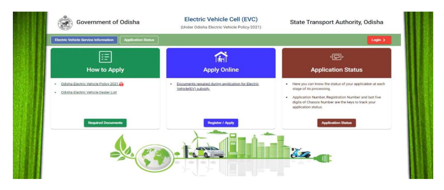
Electric Vehicle Subsidy Portal

The vehicles purchased on or after 1.9.2021 would be eligible for the subsidy. As per the current policy, the provision of subsidy would continue onwards for 4 years from 1.9.2021. For two-wheelers the subsidy would be 15 per cent of the cost, up to a maximum ceiling of Rs 5,000; for three wheelers the cap on 15 per cent subsidy would be Rs. 10,000; and for four-wheelers, it would Rs. 50,000. Shri Mahapatra also sanctioned the first subsidy through the portal in favor of one two-wheeler vehicle owned by one Shri Trilochan Behera under RTO-II of Bhubaneswar.