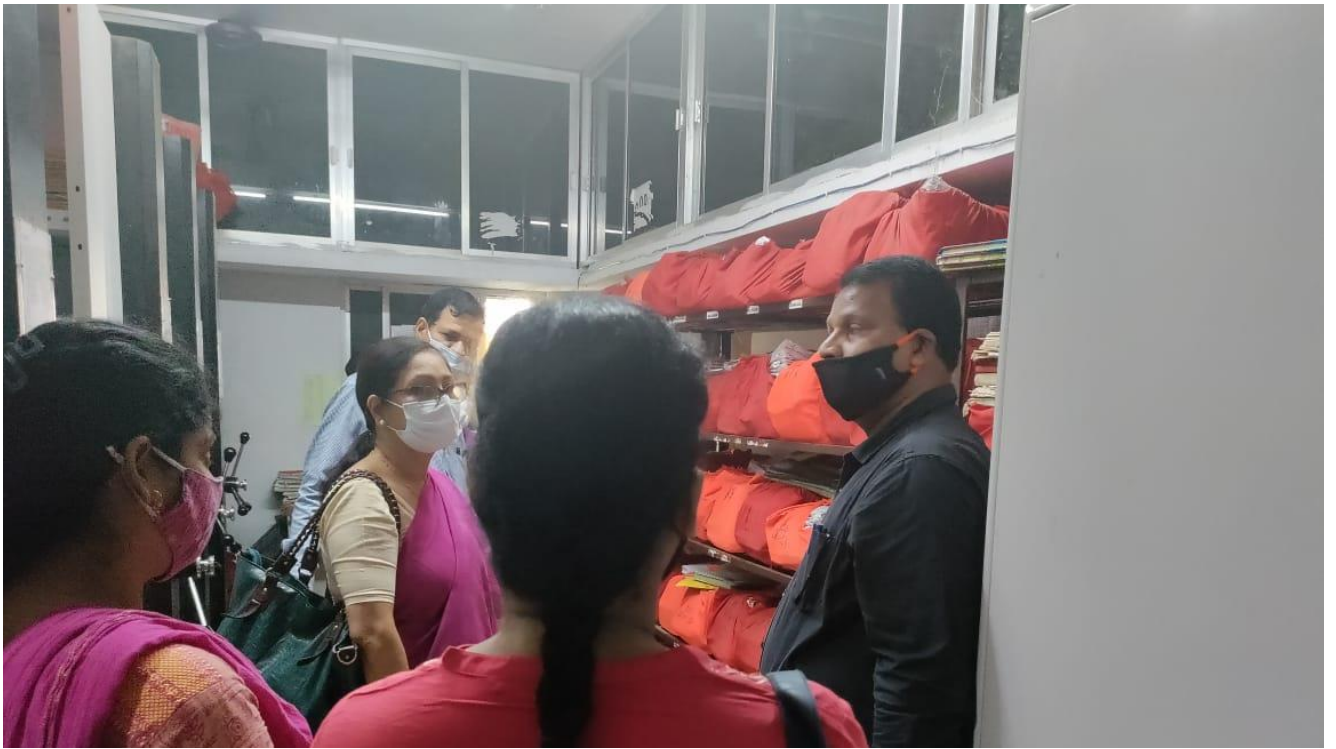
SIO visiting the Record room