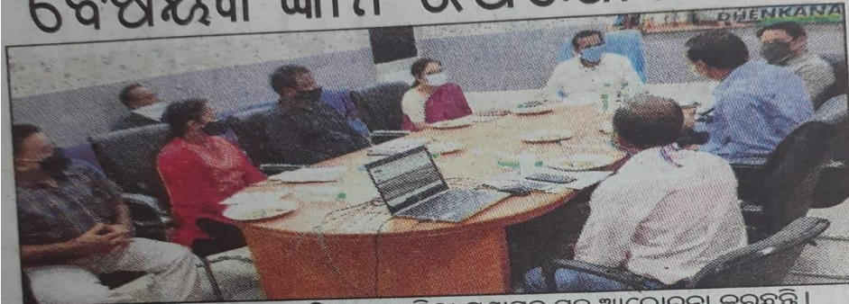
ରାଷ୍ଟ୍ରୀୟ ସୂଚନା ବିଜ୍ଞାନ କେନ୍ଦ୍ର ଓଡ଼ିଶା ମୁଖ୍ୟ ଜିଲ୍ଲା ପ୍ରଶାସନ ସହ ଆଲୋଚନା କରୁଛନ୍ତି ।