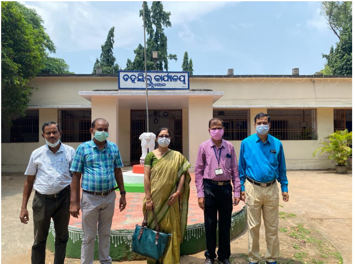
SIO with NIC officials at Tahasil office, Angul

Later, SIO visited Tahasil Office, Angul. A meeting was held with the Tahasildar, Addl. Tahasildar and Revenue Field Officials. ASIO and DIO Angul were also present. Tahasildar, Angul presented various activities going on in Tahasil. Discussion was held on various ongoing software projects like DWIST portal, Online mutation cases through LRMS, Revenue Court Case Monitoring System, Bhunaksha, Disaster Assistance Monitoring and Payment System etc.