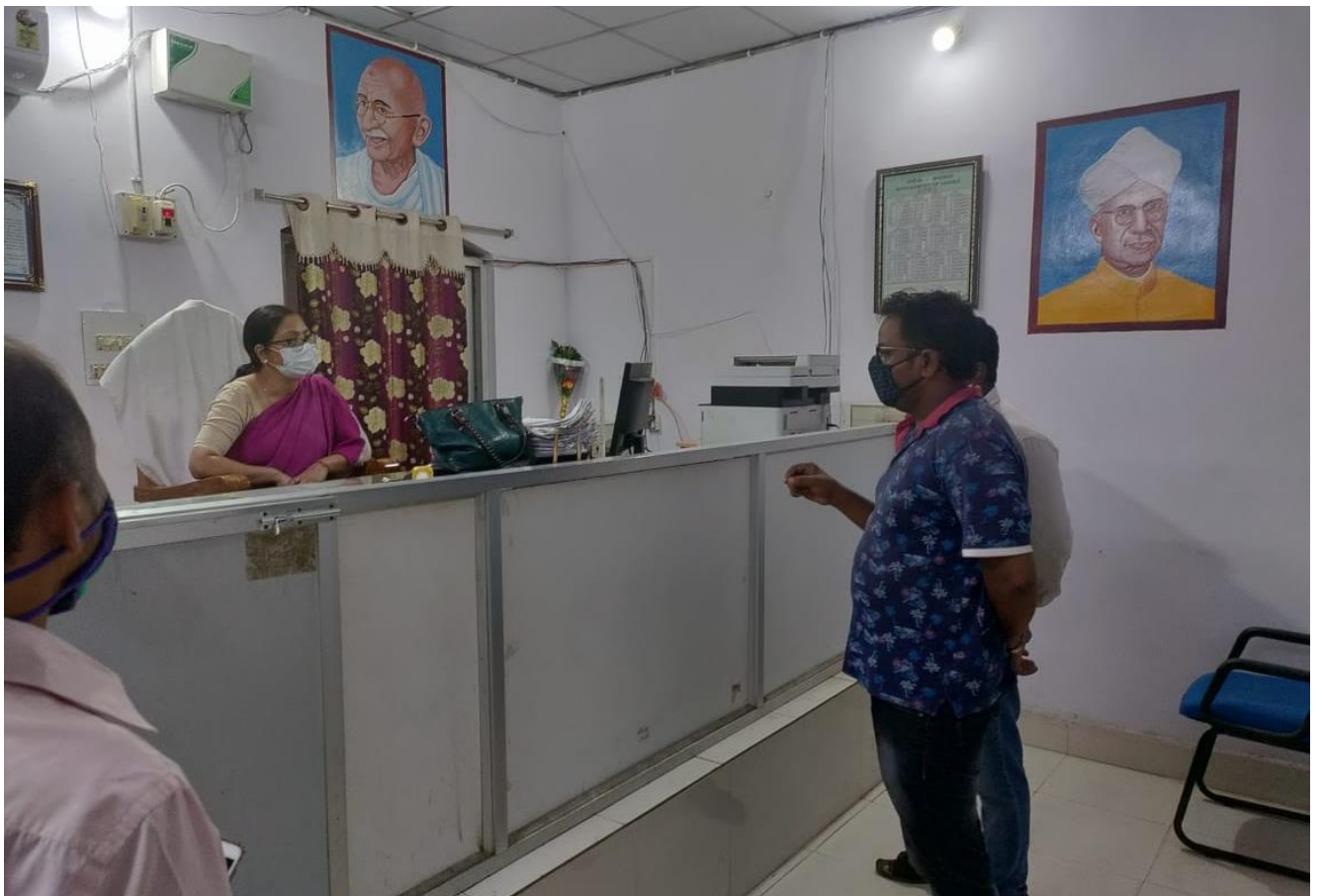
SIO interacting with District officials