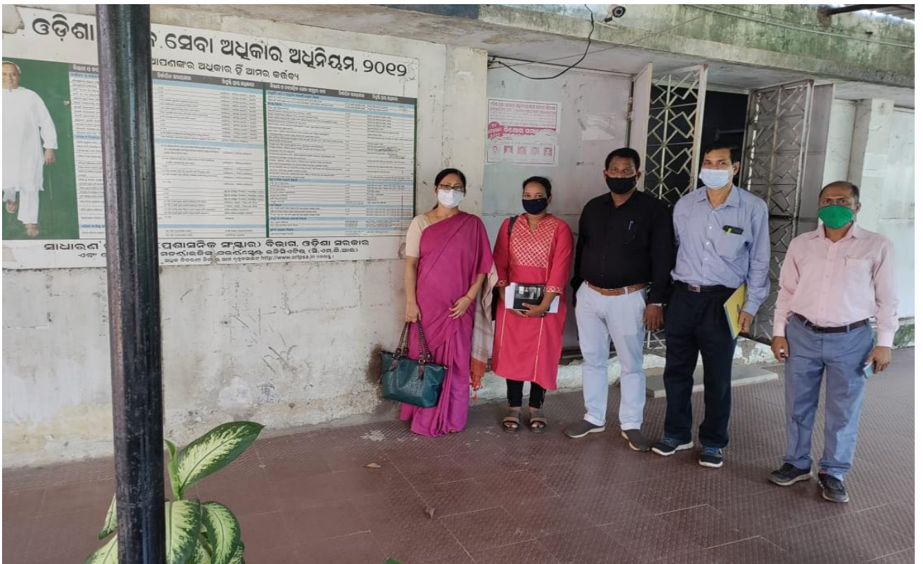
DDG & SIO with District and NIC officials at Dhenkanal