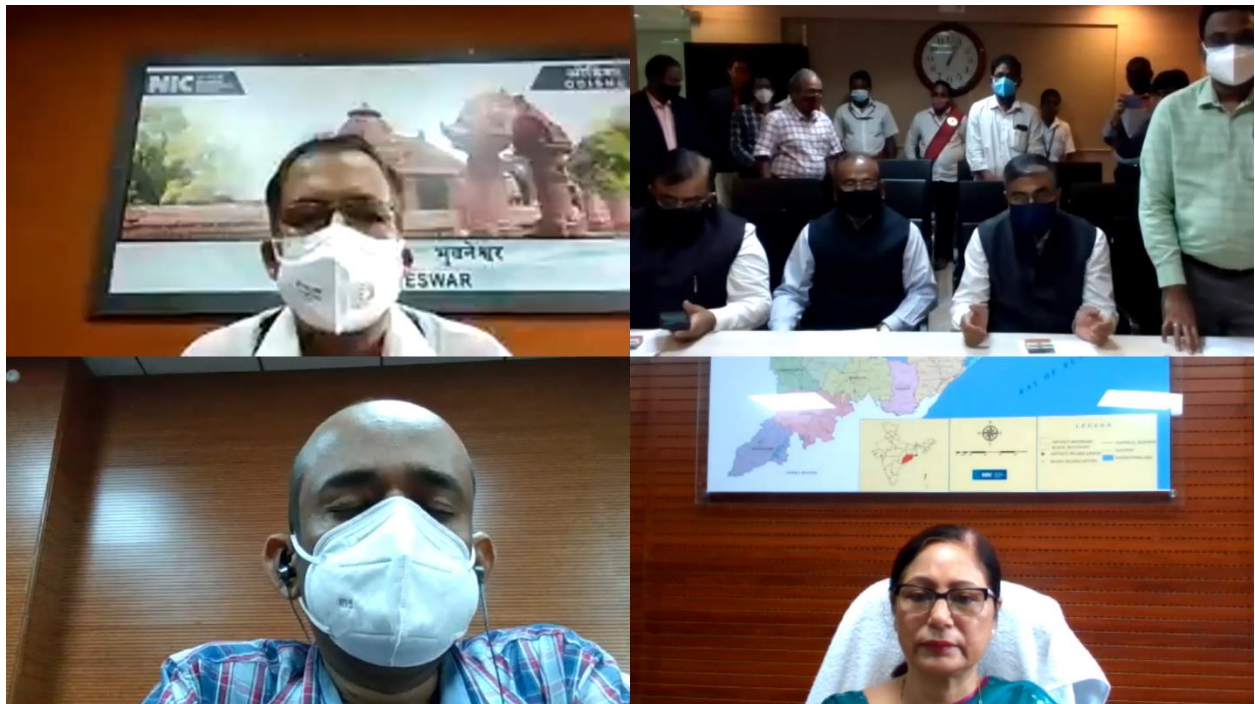
DDG & SIO gave an overview of the website.