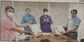
School and mass education minister Samir Ranjan Dash at the inauguration in Bhubaneswar

Bhubaneswar: After launching YouTube classes for students of Class IX and X, the state government on Thursday launched e-Pathsala and e-Mulyankan facilities keeping in mind disruption of classes during the ongoing pandemic. These online platforms will benefit students, teachers and district education officers (DEOs).