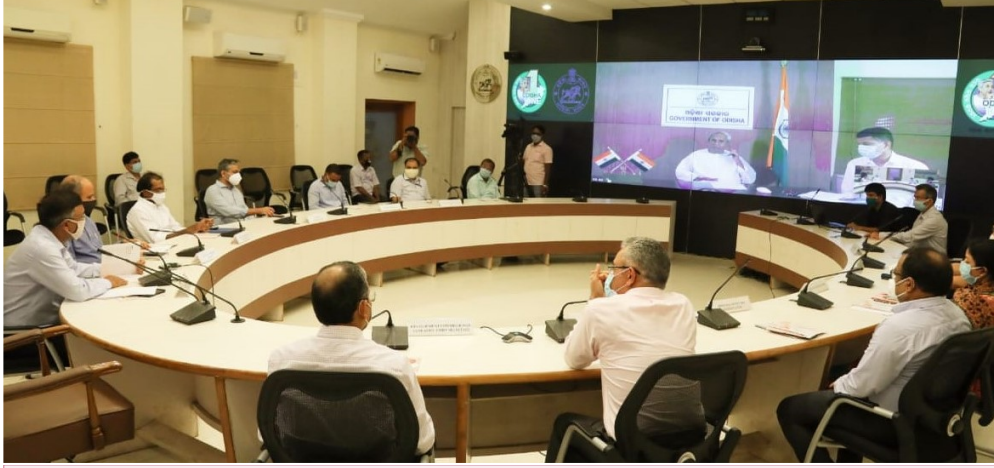
माननीय मुख्यमंत्री के द्वारा eBhawan का उद्घाटन