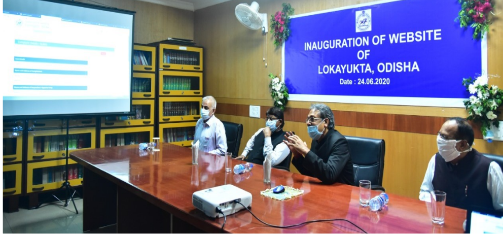
लोकायुक्त, ओडिशा की वेबसाइट का उद्घाटन