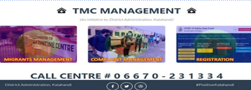
NIC कलाहांडी का TMC MIS का स्क्रीनशॉट

राष्ट्रव्यापी बंद के दौरान, COVID 19 महामारी की जांच करने के लिए, राज्य के प्रवासी नागरिकों की अचानक वापसी के कारण उत्पन्न स्थिति से निपटना, जिला