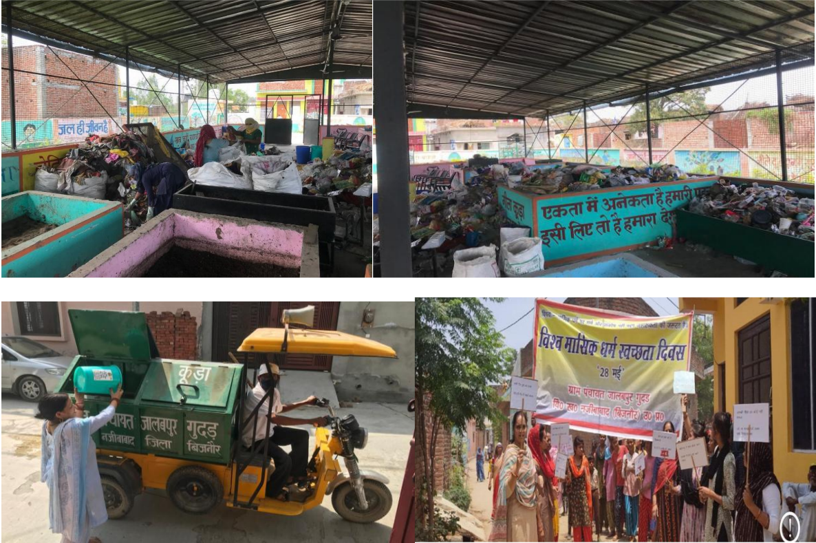
चित्र 41: बाईं ओर से चित्र – (क) और (ख) RRC केंद्र पर कचरा का पृथक्करण, (ग) घर-घर जाकर कचरा संग्रहण, (घ) स्वच्छता जागरूकता अभियान

जलाबपुर गुदल ग्राम पंचायत ने स्वच्छता परिणामों को बेहतर बनाने के साथ-साथ अपने 'स्वयं के स्रोत से राजस्व' (OSR) को मज़बूत करने के लिए ठोस और तरल अपशिष्ट प्रबंधन के प्रति एक एकीकृत दृष्टिकोण अपनाया। पर्यावरणीय गिरावट और सीमित वित्तीय संसाधनों की दोहरी चुनौती को पहचानते हुए, ग्राम पंचायत ने अपशिष्ट के व्यवस्थित पृथक्करण, खाद बनाने और ग्रे-वॉटर प्रबंधन के उपाय शुरू किए। जलाबपुर गुदल उत्तर प्रदेश की एकमात्र ऐसी ग्राम पंचायत है, जिसने हाल ही में वर्ष 2023-24 में अपशिष्ट के लिए 'उपयोगकर्ता शुल्क' (User Fees) लेना शुरू किया है, जिससे उसे OSR के रूप में 50,658 रुपये का राजस्व प्राप्त हुआ है।