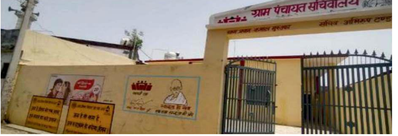
चित्र 46: पंचायत भवन का निर्माण