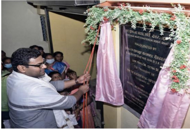
चित्र 50: बाज़ार राजस्व मॉडल – सुभाषग्राम, अंडमान और निकोबार द्वीप समूह