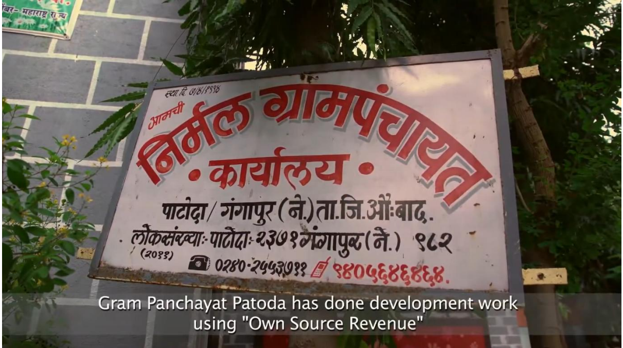
चित्र 25: पाटोदा ग्राम पंचायत

पाटोदा ग्राम पंचायत, जो औरंगाबाद शहर से लगभग 13 किलोमीटर की दूरी पर स्थित है, लगभग 600 परिवारों को सेवाएं प्रदान करती है तथा प्रोत्साहन-आधारित शासन व्यवस्था के माध्यम से पूर्ण कर अनुपालन का एक आदर्श उदाहरण बनकर सामने आई है। पूर्व में जल-संकट एवं वित्तीय सीमाओं से ग्रस्त यह ग्राम, समय के साथ स्वयं को पक्की सड़कों, स्वच्छता सुविधाओं तथा विश्वसनीय पेयजल प्रणाली से युक्त एक सुविकसित बस्ती के रूप में विकसित कर चुका है। इसका मॉडल, पंचायती राज मंत्रालय द्वारा आयोजित 'आइकॉनिक वीक' के दौरान स्वयं के स्रोतों से राजस्व (OSR) संग्रहण के क्षेत्र में एक उत्कृष्ट प्रथा (Best Practice) के रूप में प्रदर्शित किया गया।