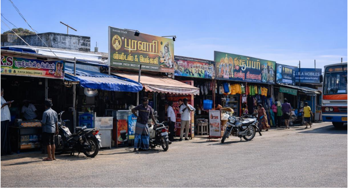
चित्र 29: इंटरनेट से लिया गया सांकेतिक चित्र

ग्राम पंचायत द्वारा 20 व्यावसायिक दुकानों के किराये से प्रतिवर्ष लगभग ₹24 लाख का राजस्व प्राप्त होता है, जो प्रति दुकान औसतन ₹1.2 लाख प्रतिवर्ष है। इन दुकानों का आवंटन पारदर्शी प्रक्रिया के माध्यम से किया जाता है, जिससे बाजार दर के अनुसार किराया सुनिश्चित होता है और खाली रहने की संभावना कम रहती है।