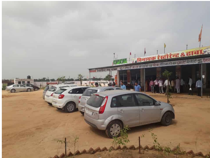
चित्र 27: राजमार्ग के चित्रात्मक चित्र