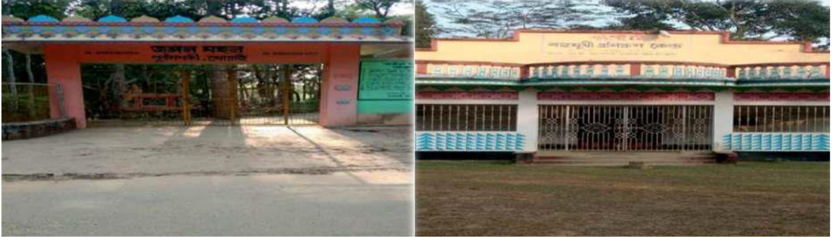
चित्र 18: बाएं से दाएं चित्र (क) जंगल महल इको-पार्क (ख) मुकुट सामुदायिक हॉल

खोवाई ब्लॉक मुख्यालय से 3 किलोमीटर दूर स्थित पुरबा गनकी ग्राम पंचायत में छह बस्तियां हैं जिनमें 980 परिवार रहते हैं और जनसंख्या 3,640 है। मुख्य रूप से कृषि प्रधान और वन क्षेत्रों से घिरी यह ग्राम पंचायत, अपने स्वयं के राजस्व स्रोत (ओएसआर) को मजबूत करने के लिए एक विविध परिसंपत्ति-आधारित मॉडल को सफलतापूर्वक विकसित कर चुकी है, जिससे सालाना ₹9.24 लाख की आय होती है।