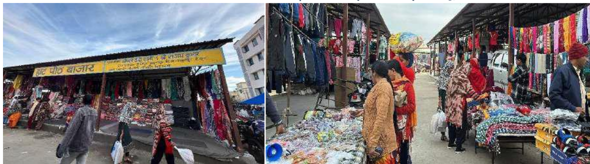
चित्र 7: (क) और (ख): हाट बाजार - रानीपोखरी जीपी, उत्तराखंड

चित्र 12: बाएं से दाएं – (क) रानीपोखरी ग्राम पंचायत द्वारा समर्थित जैविक स्टोर, उत्तरा; (ख) और (ग) उत्तराखंड के रानीपोखरी ग्राम पंचायत में सीएसआर पहल के सहयोग द्वारा प्राप्त स्वच्छता।