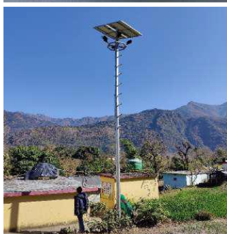
चित्र 5: (ड) शुल्क का हिसाब रखने वाला रजिस्टर; (च) गाँव का चिन्ह जो गर्व की भावना प्रदान करता है; (छ) सौर स्ट्रीटलाइट