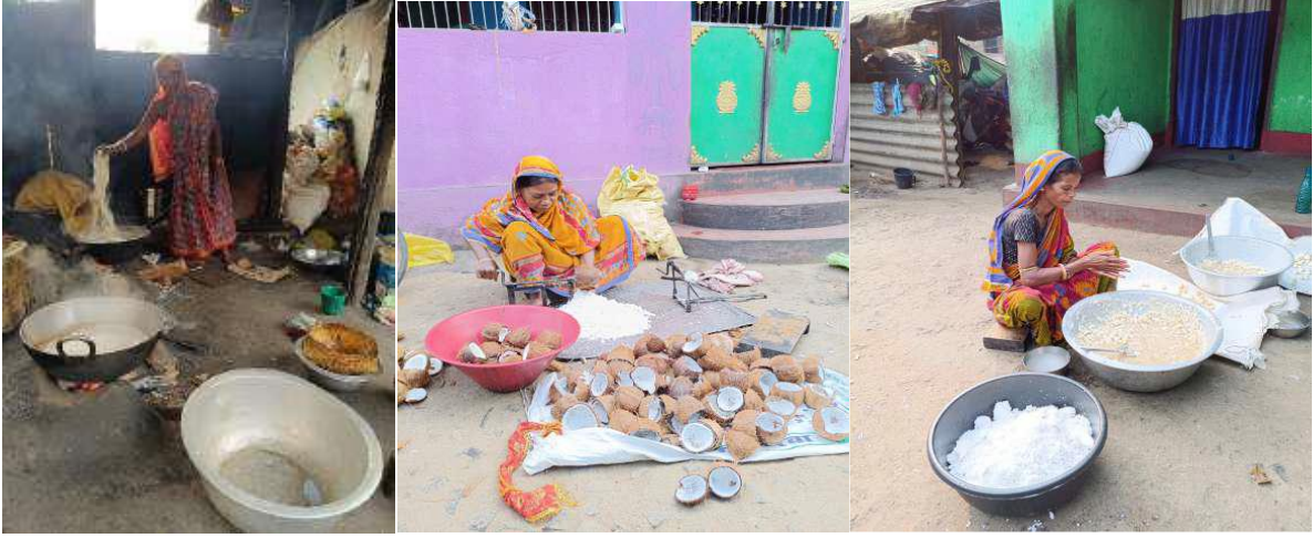
चित्र 9 : ओडिशा के मुकुंदपुरपटना ग्राम पंचायत में स्वयं सहायता समूहों द्वारा संचालित नारियल प्रसंस्करण इकाई

ओडिशा के आदिवासी क्षेत्र में स्थित मुकुंदपुरपटना ग्राम पंचायत में 11 वार्डों में फैले लगभग 8,000 लोगों की आबादी वाले छह गाँव शामिल हैं। कृषि, लघु व्यापार और स्थानीय बाजार अधिकांश परिवारों की आजीविका के मुख्य स्रोत हैं। पंचायत की एक प्रमुख विशेषता यहाँ स्थित प्रसिद्ध तारिणी माता मंदिर है, जो प्रतिवर्ष लगभग एक करोड़ श्रद्धालुओं को और नव वर्ष जैसे विशेष अवसरों पर तीन लाख तक श्रद्धालुओं को आकर्षित करता है। तीर्थयात्रियों के भारी आगमनसे आसपास के क्षेत्र में महत्वपूर्ण आर्थिक गतिविधि पैदा हुई है। इस क्षमता को पहचानते हुए, ग्राम पंचायत ने आजीविका का समर्थन करते हुए स्वयं के राजस्व स्रोत (ओएसआर) उत्पन्न करने के लिए बाजारों, सार्वजनिक अवसंरचना और स्थानीय संसाधनों के प्रबंधन के लिए एक सुनियोजित दृष्टिकोण अपनाया है।