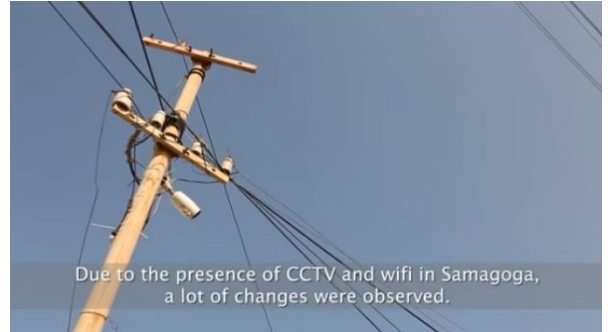
Due to the presence of CCTV and wifi in Samagoga, a lot of changes were observed.