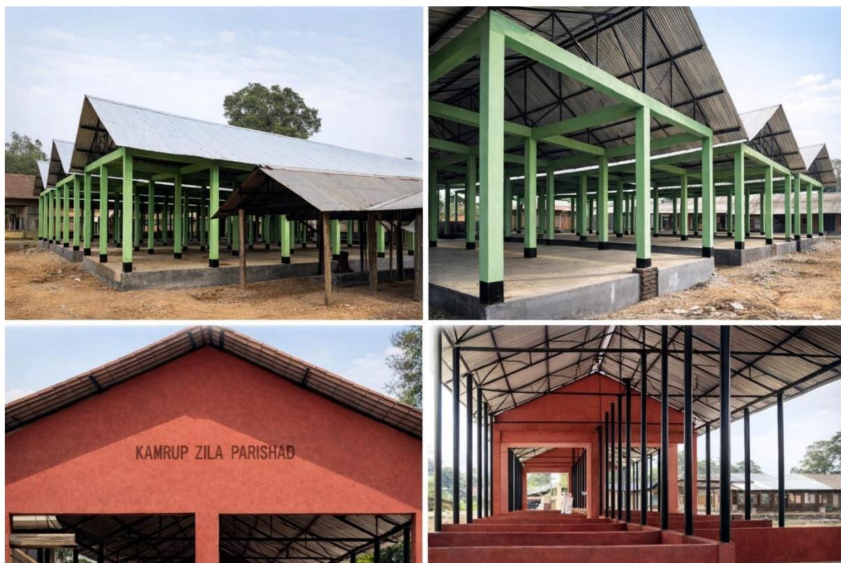
चित्र 35: ग्राम पंचायत द्वारा सृजित व्यावसायिक परिसंपत्तियां

ओएसआर से प्राप्त राजस्व का उपयोग मुख्य रूप से पंचायत के दैनिक संचालन खर्च—जैसे प्रिंटिंग और स्टेशनरी, ग्राम सभा कार्यालयों का आयोजन, बिजली बिल तथा कार्यालय कर्मचारियों और प्रदाताओं के मानदेय—के लिए किया जाता है। ओएसआर और दैनिक प्रशासन के बीच इस स्पष्ट संबंध से पंचायत के कार्यों की निरंतरता बनी रहती है।