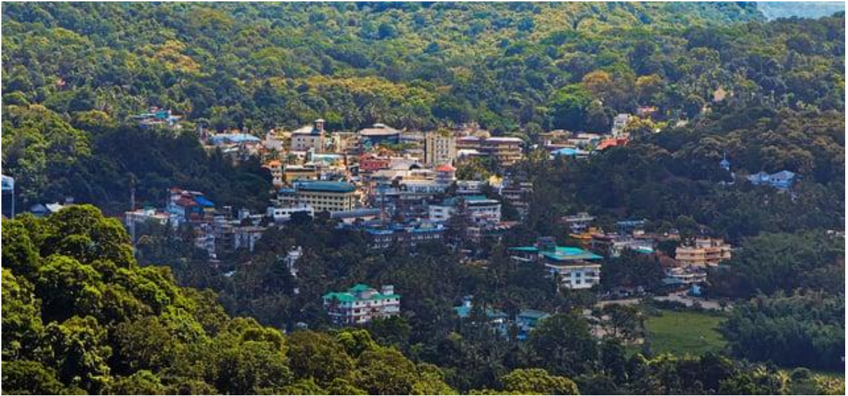
चित्र 31: स्रोत इंटरनेट से लिया गया सांकेतिक चित्र-

इसके बावजूद, 2000 के दशक के मध्य तक रिसॉर्ट और होटलों पर संपत्ति कर का सही आकलन न होने के कारण स्वयं के स्रोतों से राजस्व (OSR) अपेक्षाकृत कम था। इस कमी को ध्यान में रखते हुए, ग्राम पंचायत ने कर व्यवस्था को वास्तविक व्यावसायिक मूल्य के अनुरूप बनाने और वित्तीय स्थिति को मजबूत करने के लिए एक व्यवस्थित सुधार प्रक्रिया शुरू की।