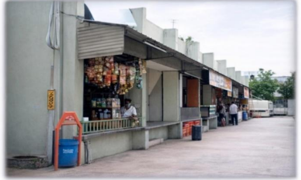
चित्र 32: धर्मज, गुजरात द्वारा की गई पहलें

विशेष बात यह है कि ग्राम पंचायत चारागाह (गौचर) भूमि से प्रबंधित घास उत्पादन और फलदार पेड़ों के माध्यम से प्रतिवर्ष ₹25 लाख से अधिक की आय प्राप्त करती है। इस व्यवस्था के तहत लगभग 400 परिवारों को प्रतिदिन कम लागत पर चारा और अन्य उत्पाद उपलब्ध कराए जाते हैं।