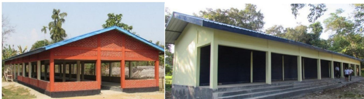
चित्र 20: बाजार शेड