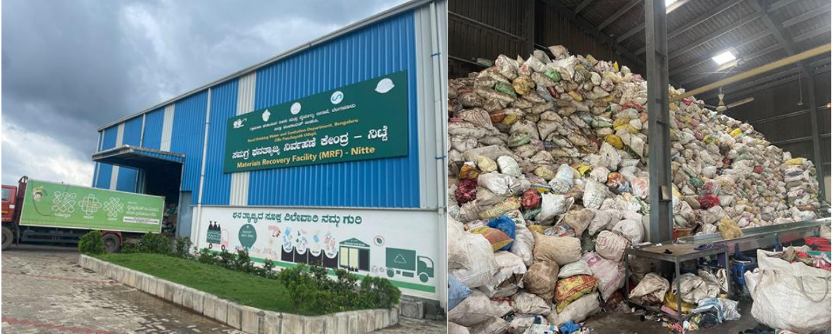
चित्र 40: (क) सामग्री पुनर्प्राप्ति सुविधा, निट्टे (ख) अपशिष्ट भंडारण सुविधा, नित्ते

कर्नाटक की पहली 'मटेरियल रिकवरी फैसिलिटी' (MRF) उडुपी ज़िले की निट्टे ग्राम पंचायत में स्थापित की गई थी, और यह इस क्षेत्र में मौजूद ऐसी पाँच फैसिलिटीज़ में सबसे पुरानी है। MRF को ज़िला पंचायत के जल एवं स्वच्छता विभाग के तहत गाँव के पीने के पानी के फंड का इस्तेमाल करके बनाया गया था। इस पहल का उद्देश्य ग्रामीण क्षेत्रों में ठोस कचरा प्रबंधन की बढ़ती चुनौतियों का समाधान करना था, और साथ ही एक आर्थिक रूप से स्थायी परिचालन मॉडल तैयार करना था।