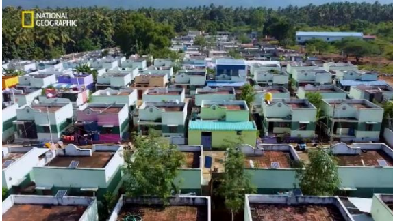
चित्र 23: ओदंथुराई ग्राम पंचायत

यह विंडमिल प्रतिवर्ष लगभग 6 लाख यूनिट बिजली उत्पन्न करती है, जिसे तमिलनाडु जनरेशन एंड डिस्ट्रीब्यूशन कॉर्पोरेशन (राज्य विद्युत बोर्ड) को बेचा जाता है। बिजली की बिक्री से पंचायत को ₹16 लाख से अधिक की स्थिर वार्षिक आय प्राप्त होती है, जिससे राजस्व का एक सतत स्रोत बनता है।