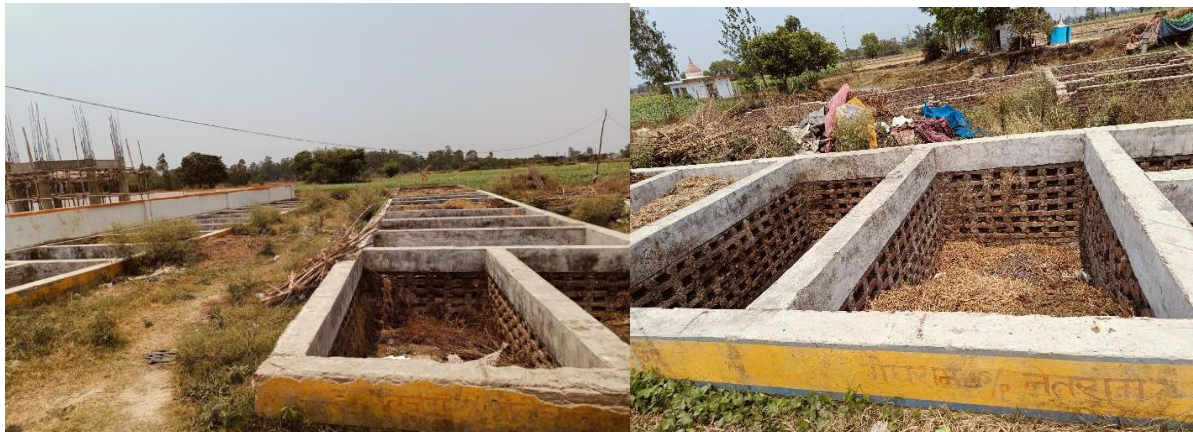
चित्र 42: जलाबपुर गुदल ग्राम पंचायत में कम्पोस्ट पिट

सकता है। स्वच्छता से जुड़ी पहलों को आय सृजन करने वाले साधनों में बदलकर और कॉर्पोरेट साझेदारियों का लाभ उठाकर, इस ग्राम पंचायत ने पर्यावरण के प्रति ज़िम्मेदार और आर्थिक रूप से सशक्त ग्रामीण शासन का एक ऐसा मॉडल तैयार किया है, जिसे दूसरी जगहों पर भी दोहराया जा सकता है।