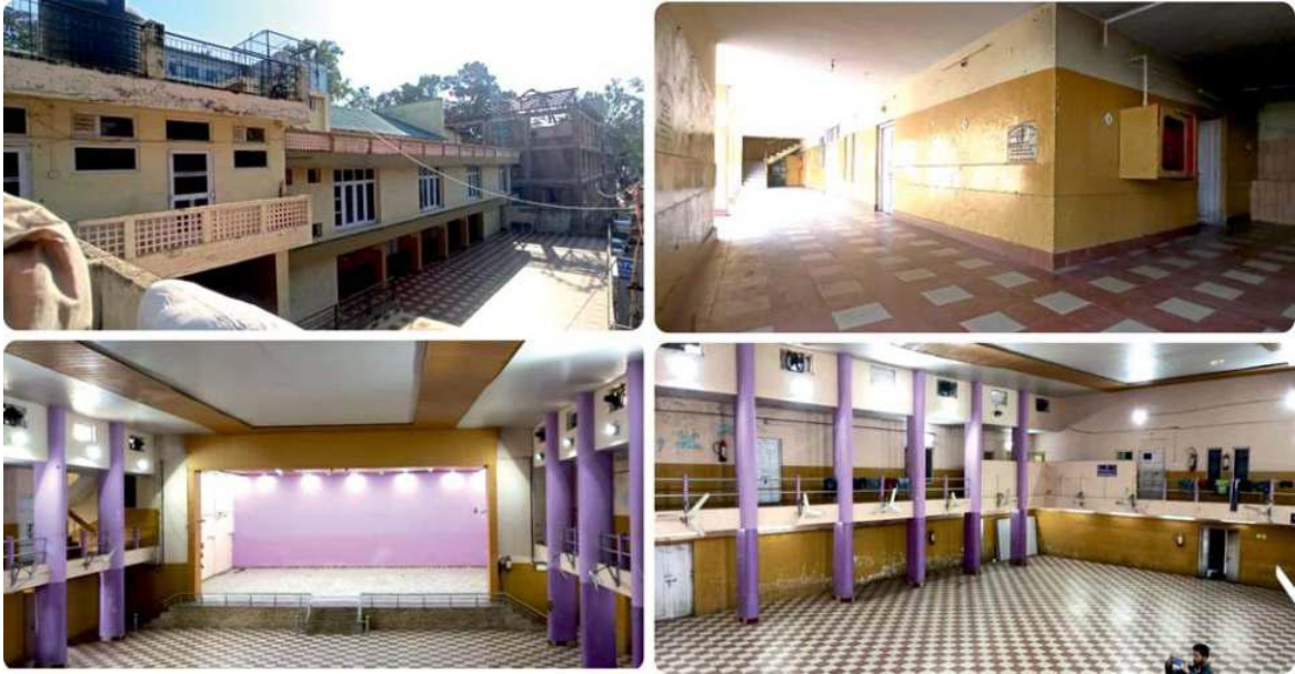
चित्र 37: सामुदायिक भवन और व्यावसायिक दुकानों का मुद्रीकरण

17 निर्वाचित सदस्यों (जिनमें 9 महिलाएँ शामिल हैं) वाली एक मध्य-स्तरीय पंचायती राज संस्था के रूप में, ज़िला परिषद यह दर्शाती है कि किस प्रकार दीर्घकालिक अवसंरचना निवेश ग्रामीण स्थानीय सरकारों के लिए सतत वित्तीय स्वतंत्रता सुनिश्चित कर सकता है।