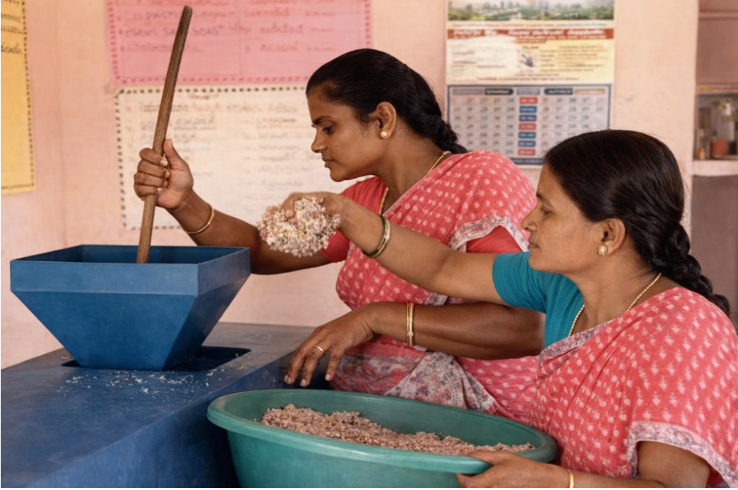
चित्र 33: पंचायत में स्थापित श्रेडिंग मशीन

नियमित उपलब्धता बनी रहती है और लोगों की भागीदारी भी बढ़ती है। यह श्रेडिंग यूनिट कम लागत में संचालित होने वाला एक स्व-टिकाऊ उद्यम है।