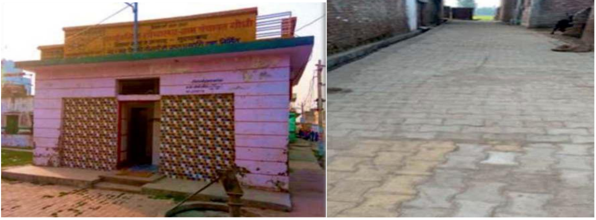
चित्र 47: बाईं से दाईं ओर चित्र (क) सामुदायिक स्वच्छता परिसर (CSC) (ख) सड़क का निर्माण