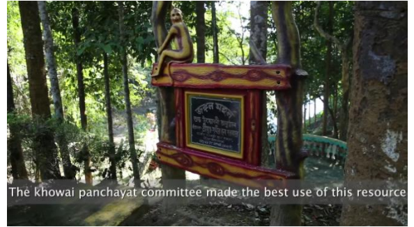
चित्र 30: खोवाई पंचायत समिति, त्रिपुरा द्वारा की गई पहलें