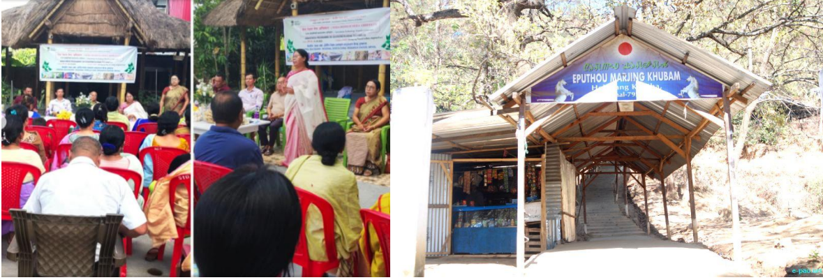
चित्र 39: बाईं से दाईं ओर चित्र- (क) और (ख) हिंगांग GP में जागरूकता अभियान; (ग) हिंगांग चिंग पर इपुथौ मार्जिंग खुबम

हिंगांग ग्राम पंचायत मणिपुर के इम्फाल पूर्वी ज़िले में स्थित है, जो ज़िला मुख्यालय पोरोमपत से लगभग 7 किलोमीटर उत्तर में है। यह पंचायत लगभग 3 वर्ग किलोमीटर के क्षेत्र में फैली हुई है और यहाँ की अनुमानित आबादी लगभग 8,000 निवासियों की है। इस गाँव की विशेषता यहाँ के विविध प्राकृतिक और सांस्कृतिक संसाधन हैं, जिनमें ताज़े पानी की झीलें, नदियाँ, पहाड़ियाँ, जंगल और समृद्ध सांस्कृतिक विरासत शामिल हैं। ये विशेषताएँ पर्यटन और समुदाय-आधारित आर्थिक गतिविधियों के अवसर प्रदान करती हैं। इन स्थानीय विशेषताओं को देखते हुए, ग्राम पंचायत ने विरासत पर्यटन, सामुदायिक अवसंरचना और सार्वजनिक उपयोगिता सेवाओं का उपयोग करके 'स्वयं के स्रोत से राजस्व' (OSR) उत्पन्न करने का एक मॉडल तैयार किया है। इन पहलों के माध्यम से, पंचायत औसतन लगभग ₹5.8 लाख का वार्षिक OSR सृजन करती है , जो स्थानीय विकास और सामुदायिक सेवाओं के रखरखाव में योगदान देता है।