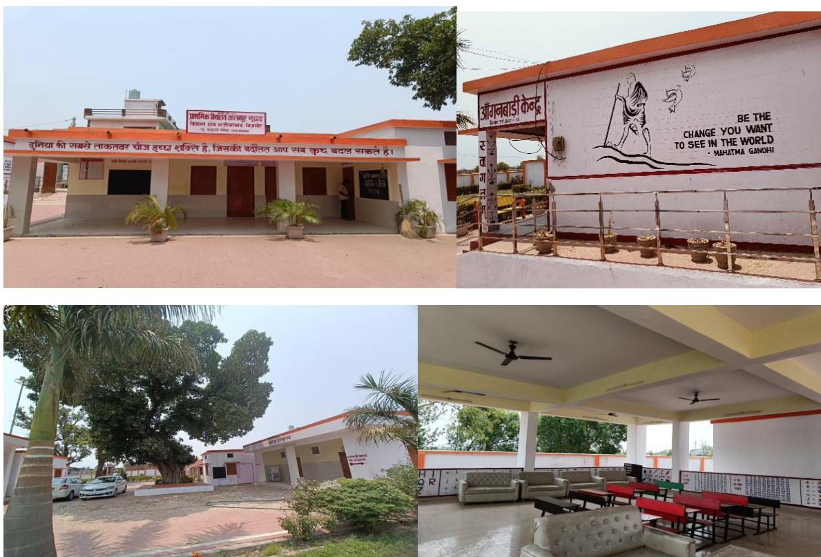
चित्र 43: बाई से दाईं ओर चित्र (क) प्राथमिक विद्यालय (ख) आंगनवाड़ी विद्यालय (ग) और (घ) आवश्यक सुविधाएं, जैसे कि कक्षा में फर्नीचर, पीने का पानी, कूलर और शौचालय।