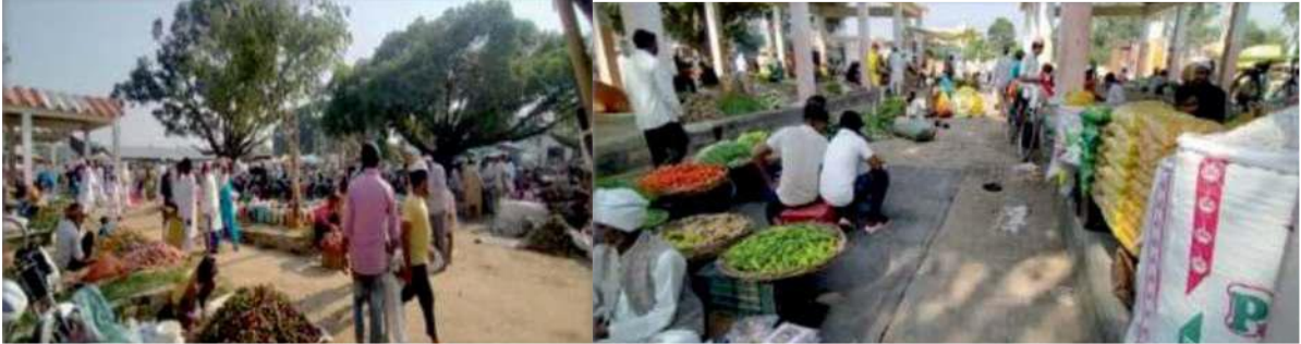
चित्र 45: साप्ताहिक हाट बाज़ार (शुक्रवार बाज़ार)

राजस्व स्टॉल शुल्क, बाज़ार शुल्क और उपयोगकर्ता शुल्क के माध्यम से सृजित होता है, जिसे पंचायत द्वारा एक व्यवस्थित तरीके से एकत्र किया जाता है। सृजित वार्षिक ओएसआर: ₹47 लाख।