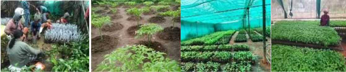
15. चित्र 1: बाएं से दाएं चित्र – (क) जिला पंचायत, केरल; (ख), (ग), (घ) और (ङ) कृषि फार्म और संबंधित प्रतिष्ठान