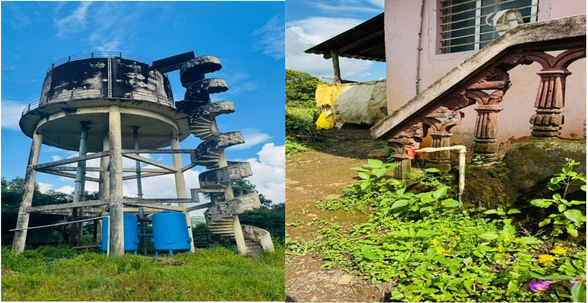
चित्र 44: बाईं से दाईं ओर चित्र (क) ग्राम पंचायत में ओवरहेड टैंक (ख) घरों तक पाइपलाइन द्वारा जल आपूर्ति

यह उपलब्धि, महाराष्ट्र सरकार के राज्य जल और स्वच्छता मिशन (SWSM) द्वारा लागू की गई हर घर नल से जल (HGNSJ) पहल के तहत जल जीवन मिशन के कार्यान्वयन से काफी हद तक जुड़ी हुई है।