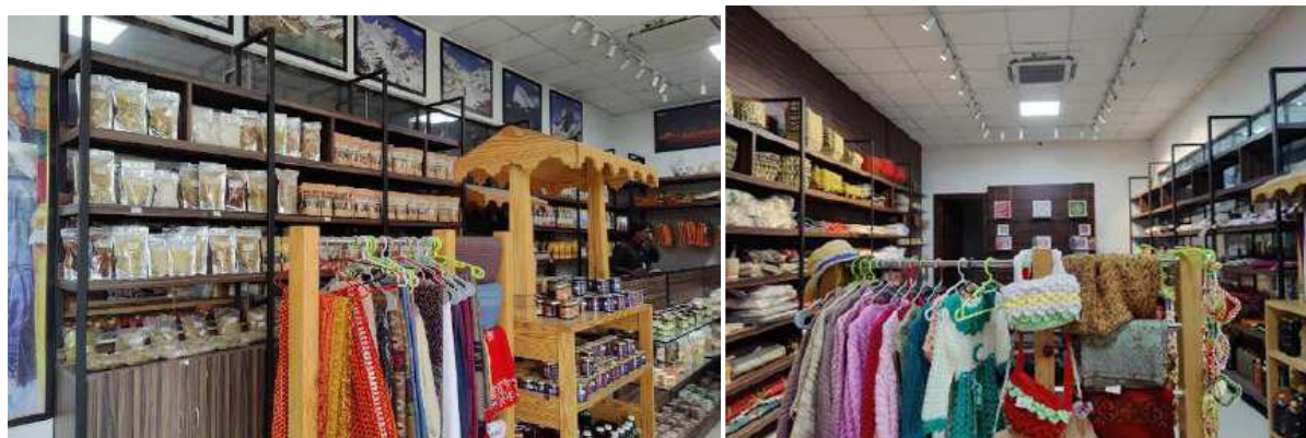
चित्र 11: उत्तराखंड के रानीपोखरी ग्राम पंचायत द्वारा समर्थित स्वयं सहायता समूहों द्वारा निर्मित जैविक और मूल्यवर्धित उत्पाद