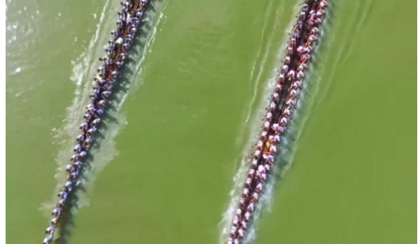
चित्र 24: जल निकाय का जीर्णोद्धार और पर्यटन को बढ़ावा देना