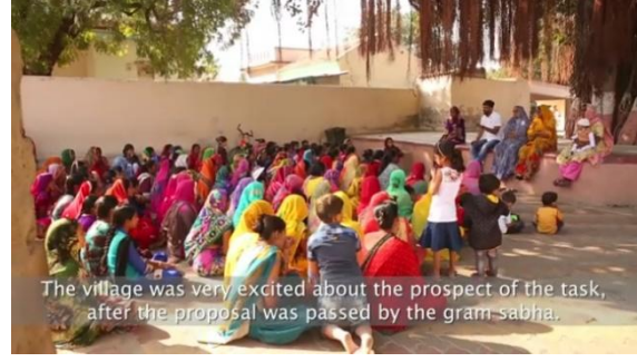
चित्र 22: सामुदायिक भागीदारी और घर-घर जाकर कर संग्रह