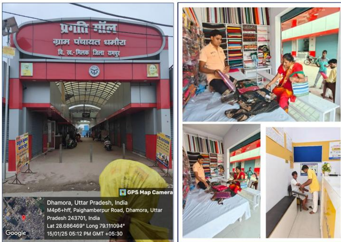
चित्र 19: वाणिज्यिक दुकानें स्थापित करने की धामोरा की पहल