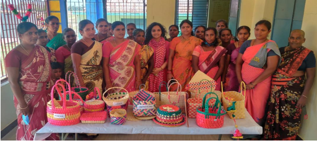
चित्र 28: नीति आयोग से संदर्भ चित्र