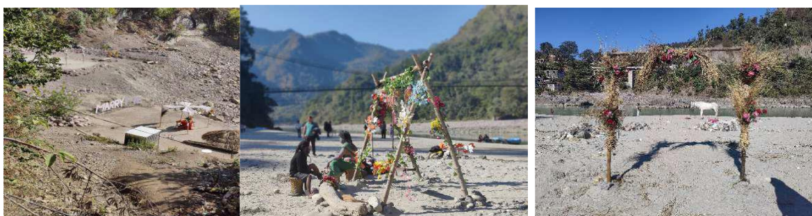
चित्र 4: (ख), (ग), (घ) प्री-वेडिंग शूट की लोकेशन