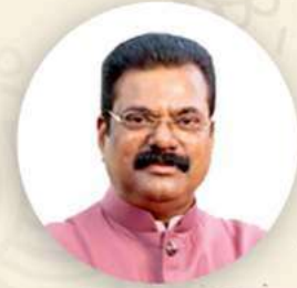
श्री कपिल मोरेश्वर पाटील केंद्रीय राज्यमंत्री, पंचायत राज