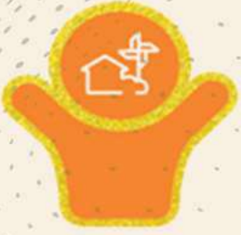
Village with Self-Sufficient Infrastructure