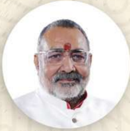
श्री गिरीराज सिंह केंद्रीय पंचायती राज आणि ग्रामविकास मंत्री ना