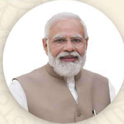
श्री नरेंद्र मोदी पंतप्रधान