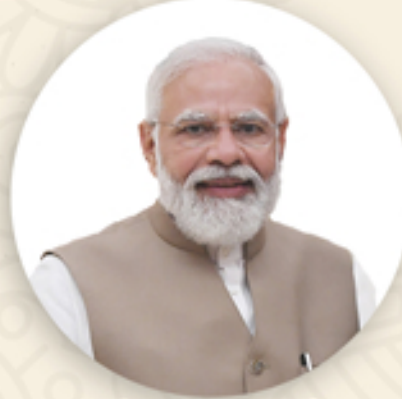
श्री नरेन्द्र मोदी प्रधान मंत्री