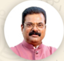
श्री कपिल मोरेश्वर पाटील केन्द्रीय राज्य मंत्री, पंचायती राज