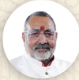
श्री गिरिराज सिंह केन्द्रीय पंचायती राज अने ग्रामीण विकास मंत्री