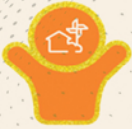
Village with Self-Sufficient Infrastructure

थीम 6:- स्वयं पर्याप्त माणभागत सुविधा साथेनुं गाम 22 अने 23 ओगस्ट, 2022, यंदीगढ, पंजाब