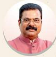
రాష్ట్ర మంత్రి నుండి సందేశం