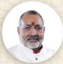
శ్రీ గిరిరాజ్ సింగ్ కేంద్ర పంచాయతీరాజ్ మరియు గ్రామీణాభివృద్ధి శాఖ మంత్రి