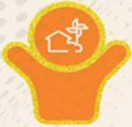
Village with Self-Sufficient Infrastructure

అవలోకనం:- పంచాయతీరాజ్ మంత్రిత్వ శాఖ PRIలో సుస్థిర అభివృద్ధి లక్ష్యాల (LSDGలు) స్థానికీకరణ ప్రక్రియను ప్రోత్సహిస్తోంది. దీని కోసం, 'హెల్ ఆఫ్ గవర్నమెంట్ మరియు హెల్ ఆఫ్ సొసైటీ' విధానంలో విభిన్న