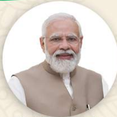
శ్రీ నరేంద్ర మోదీ ప్రధాన మంత్రి