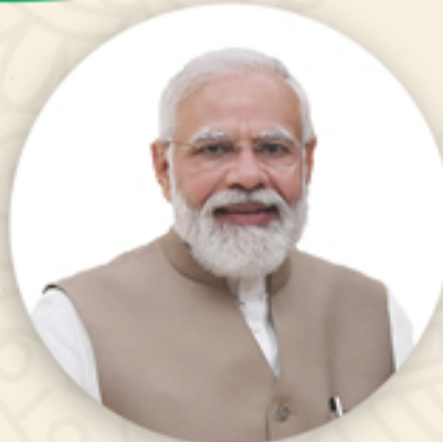
श्री नरेंदर मेदी पूषान मंत्ररी