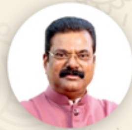
श्री कपिल मेरेसवर पाटिल केंदरी राज मंत्ररी, पंचायती राज