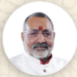
श्री गिरिराज सिंह केंद्रीय पंचायती राज अਤੇ पेंडू विकास मंत्ररी स