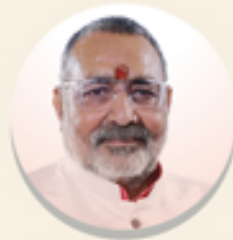
ਮੰਤਰੀ ਦਾ ਸੁਨੇਹਾ