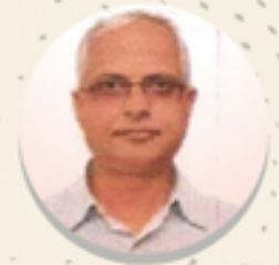
ਸਕੱਤਰ ਦਾ ਸੁਨੇਹਾ