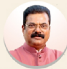
ਰਾਜ ਮੰਤਰੀ ਦਾ ਸੁਨੇਹਾ