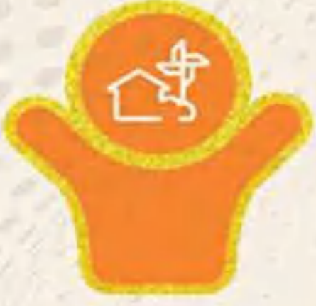
Village with Self-Sufficient Infrastructure

கருப்பொருள் 6:- தன்னிறைவு பெற்ற கிராமம் உள்கட்டமைப்பு 22 மற்றும் 23 ஆகஸ்ட், 2022, சண்டிகர், பஞ்சாப்