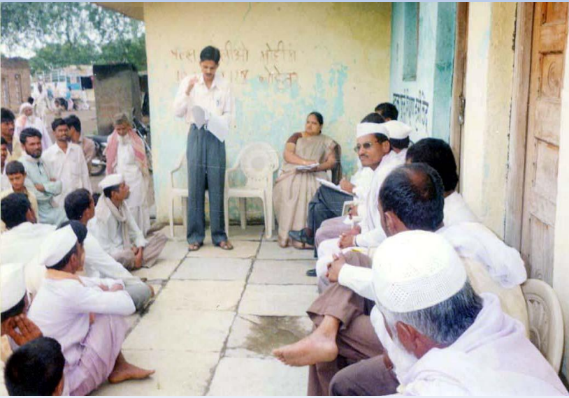
నీటి వినియోగం నిర్వహణ మరియు పారిశుధ్యం నకు సంబంధించిన కీలక అంశాలపై గృహస్తులకు అవగాహన