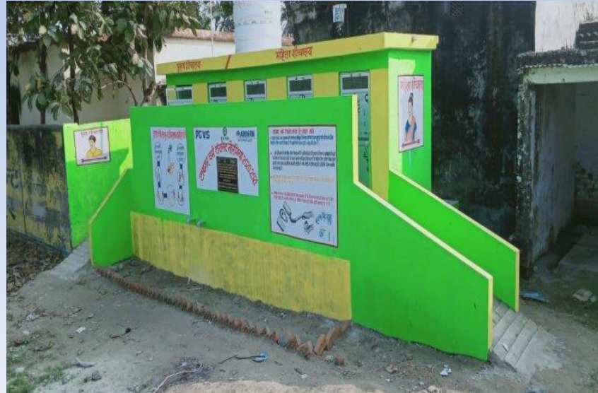
మార్కెట్లు గ్రామపంచాయతీ ఆవరణ తో సహా భహిరంగ ప్రదేశాలలో టాయిలెట్స్ నిర్వహణ జరిగేలా చూడటం .