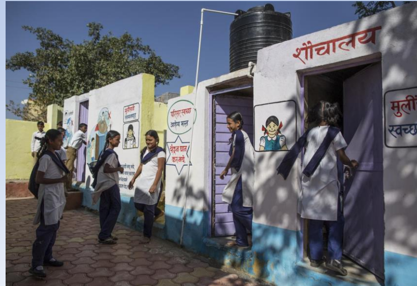
పాటశాల లు మరియు అంగన్వాడి లలో బాలురు బాలికలకు తగిన ఫంక్షనల్ టాయిలెట్లు ఏర్పాటు చేయాలి