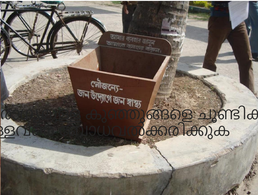
കുഞ്ഞുങ്ങളെ ചൂണ്ടിക്കാട്ടി മറ്റുള്ളവരെ ബോധവൽക്കരിക്കുക