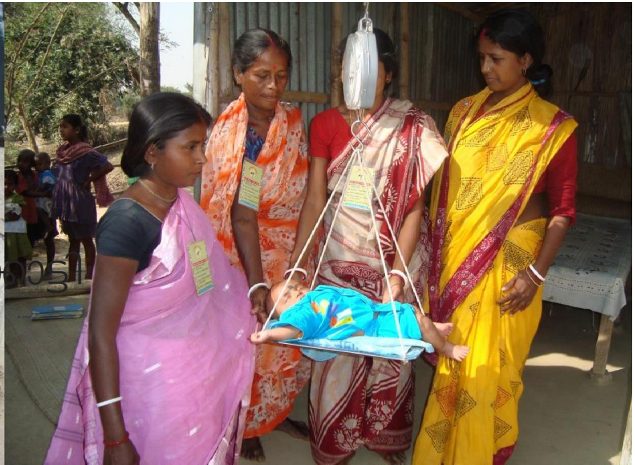
ആരോഗ്യമുള്ള കുഞ്ഞുങ്ങളെ ചൂണ്ടിക്കാട്ടി മറ്റുള്ളവരെ ബോധവൽക്കരിക്കുക