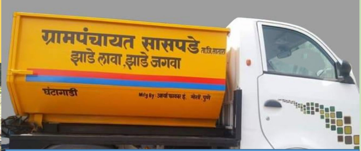
गाव पातळीवरील कचरा गोळा करणारी घंटागाडी