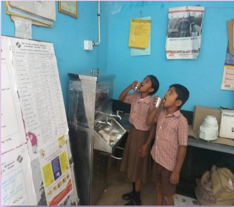
பாதுகாப்பான குடிநீர் வழங்கவும் பள்ளியில் கை கழுவும் பழக்கம் ஏற்படுத்துவதை உறுதி செய்தல்