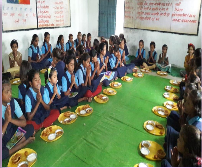
தரமான மதிய உணவு வழங்குதலை கண்காணித்தல்