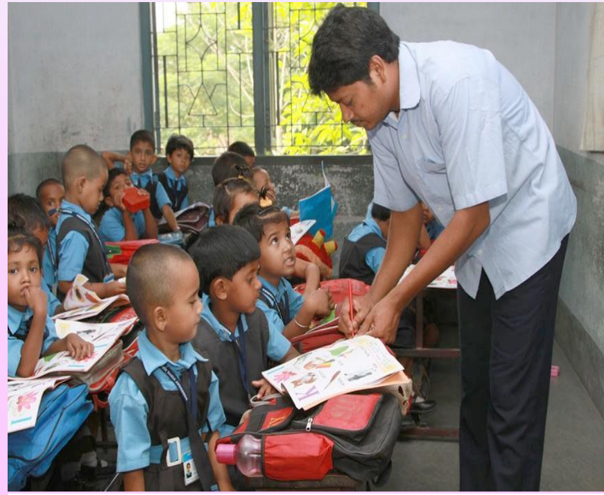
தரமான கல்வியை உறுதி செய்தல்