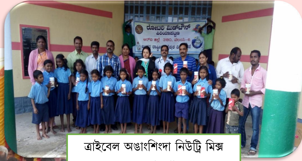
ত্রাইবেল অঙাংশিংদা নিউট্রি মিক্স য়েহ্লোকপা