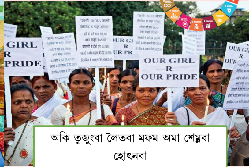
অকি তুজুংবা লৈতবা মফম অমা শেয়্বা হোৎনবা