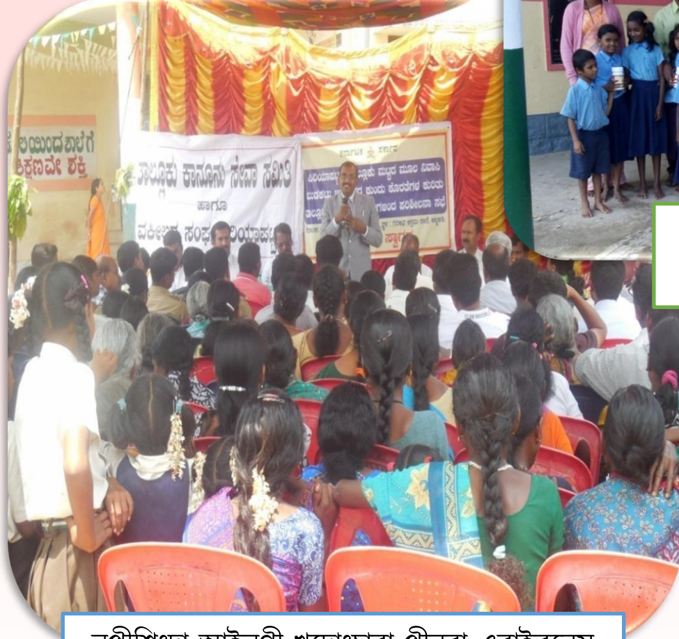
নুপীশিংদা আইনগী খুদোংচাবা পীনবা এরাইরনেস কেমপ পাঙথোকপা