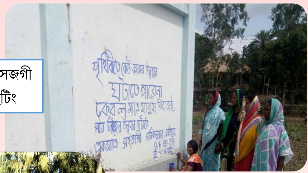
মহিলা সভা পাঙথোকপা