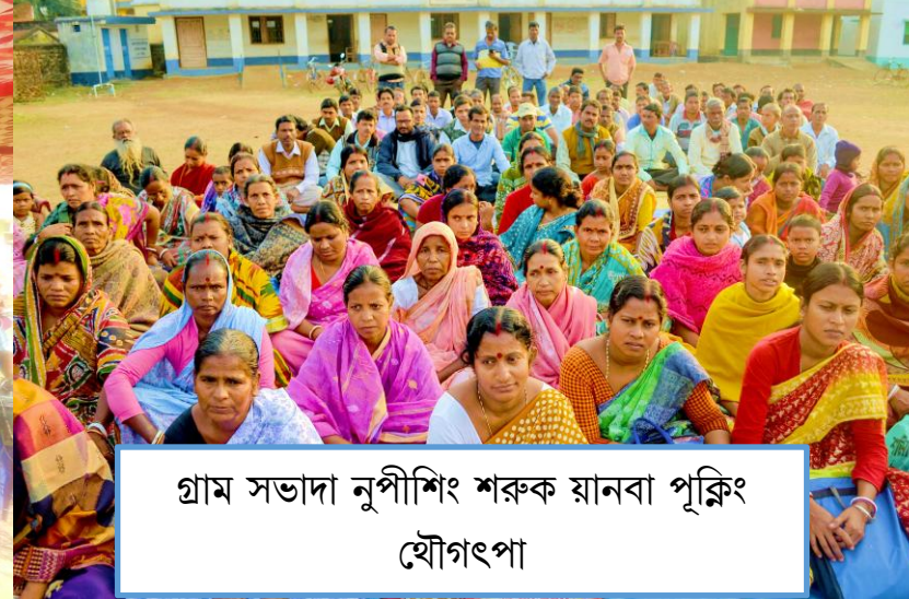
গ্রাম সভাদা নুপীশিং শরুক যানবা পুক্ৰিং হৌগৎপা