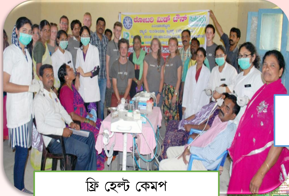
ফ্রি হেল্ট কেমপ

এস এচ জিদা অপিকপা শেনফমদা ক্রেডিট পীনবা বেক্করশিংগী কেমপেন