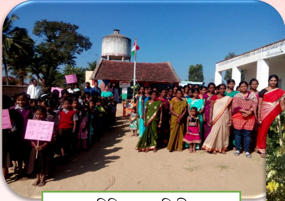
ওপন দিফিকেসন ফ্রিগীদমত্তা কেমপেন পায়খৎপা