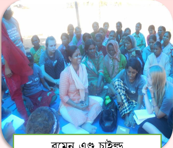
বুমেন এণ্ড চাইল্ড দিভেলপমেন্টকী ইসুশিংগী মতাংদা এরাইরনেস কেমপশিং পায়খৎপা