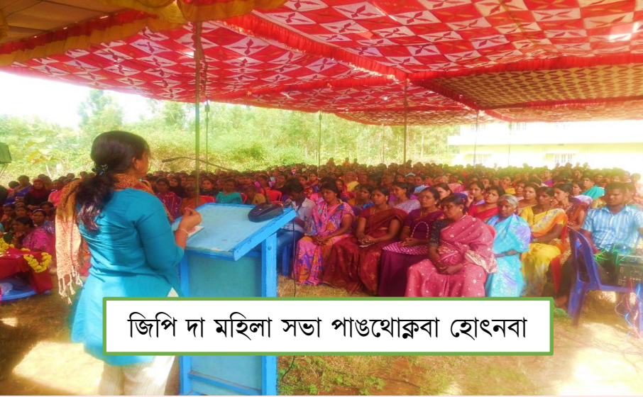
জিপি দা মহিলা সভা পাঙথোক্কা হোৎনবা