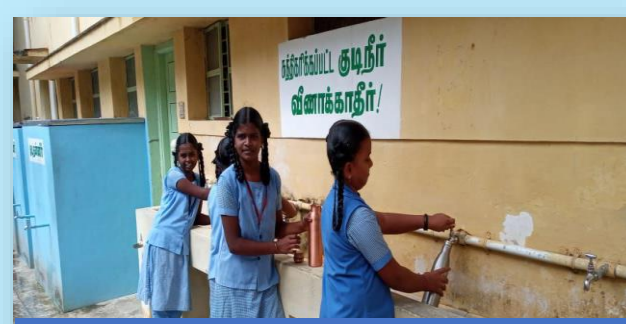
கல்வி, சுகாதார மையங்கள், சமுதாய அமைப்புகள்