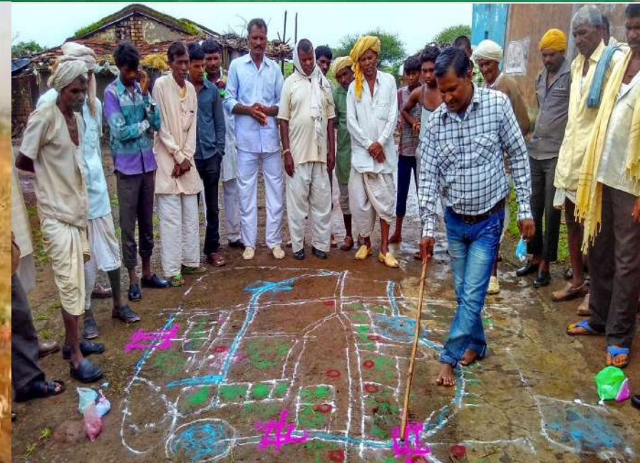
स्वच्छ और हरा-भरा गांव