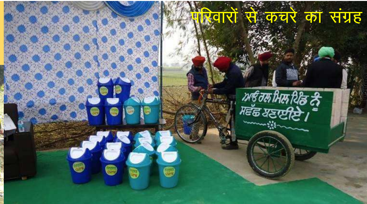
परिवारों से कचरे का संग्रह