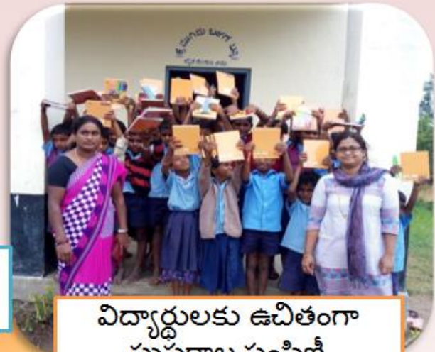
విద్యార్థులకు ఉచితంగా పుస్తకాల పంపిణీ