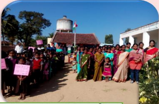
భహిరంగ మలవిసర్జన లేని గ్రామం కోసం ప్రచారం