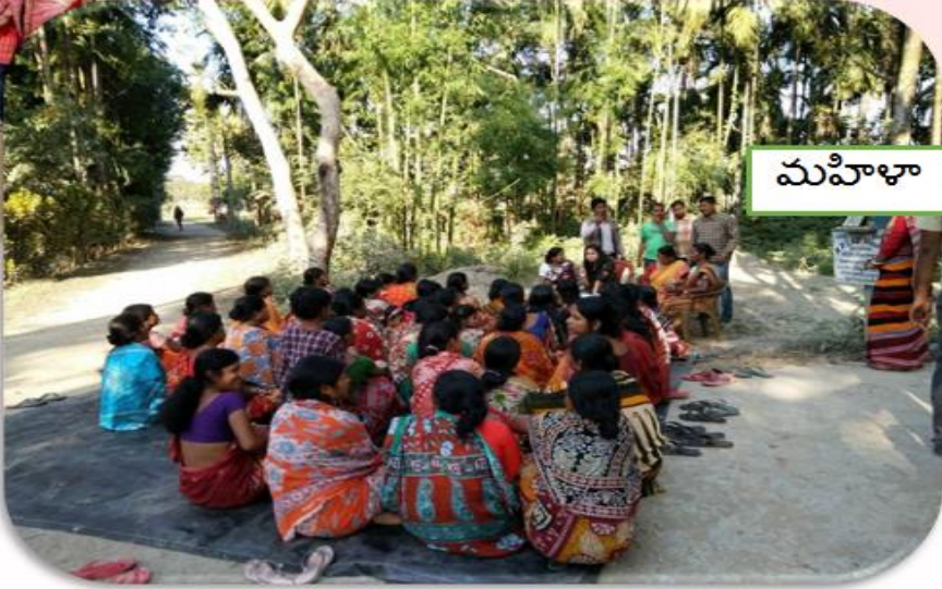
మహిళా సభల నిర్వహణ