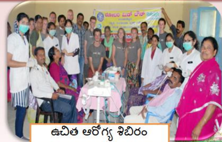
ఉచిత ఆరోగ్య శిబిరం

SHGలకు తక్కువ మొత్తాలలో పరపతి కోసం బ్యాంకర్ల ప్రచారం