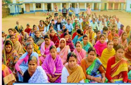
మహిళా సభలలో పాల్గొనేలా ప్రోత్సహించాలి