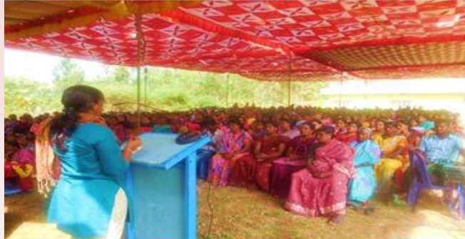
గ్రామపంచాయతిలో మహిళా సభలు నిర్వహించాలి