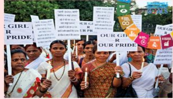
సురక్షిత మరియు భద్రతా వాతావరణం