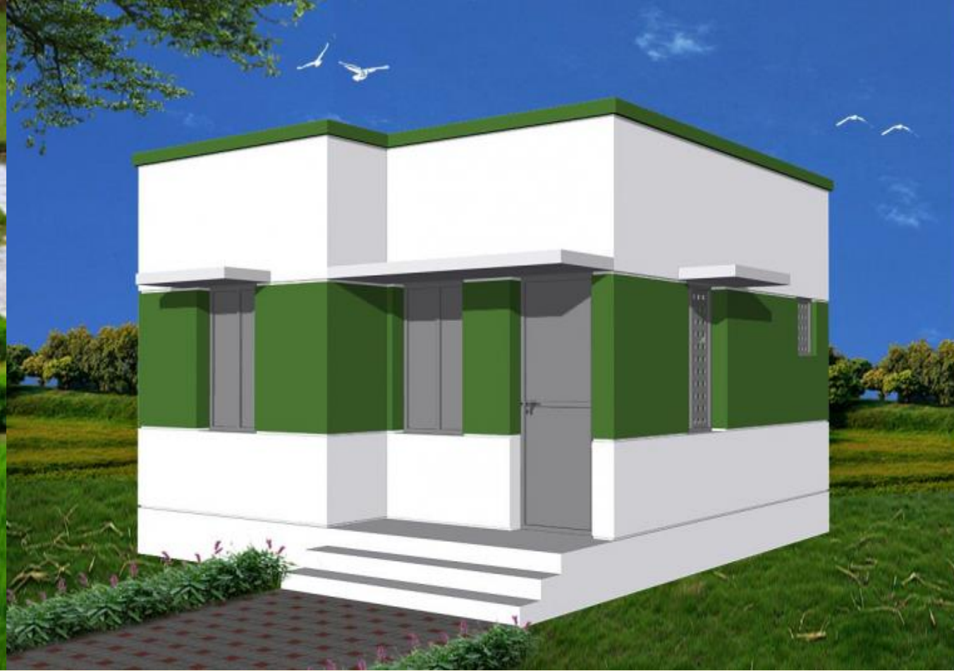
அடிப்படை தேவைகளான வீடு, குடிநீர்/சுகாதார போன்றவற்றை வழங்குவதை உறுதி செய்தல்