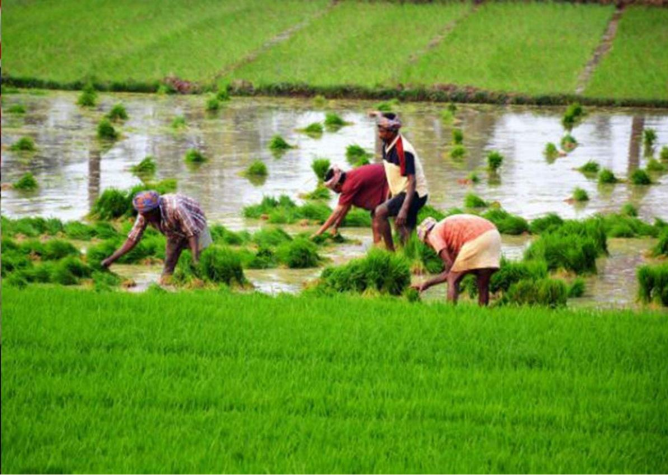
விவசாயத்தில் விவசாயிகளை ஈடுபடுத்தி வருமானத்தை உயர்த்துதல்