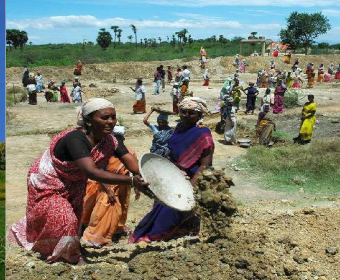
மகாத்மா காந்தி தேசிய ஊரக வளர்ச்சி திட்டத்தில் வேலை/வறுமையை குறைத்தல்