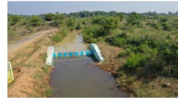
Cement concrete check dam@vellaputhur to karikkili supply channel