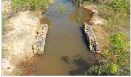
Gabion check dam @ vellaputhur to Karikkili supply channel