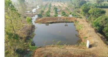
Percolation pond@Athi plantation (MTP)