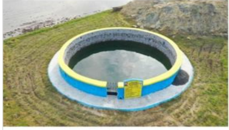
Individual dug well @ Vellaputhur