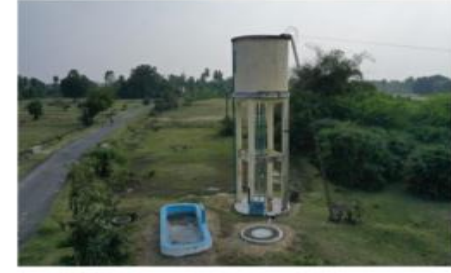
Recharge community Soak pit