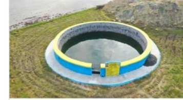
Individual dug well @ Vellaputhur