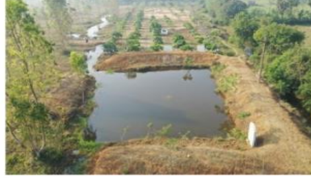
Percolation pond@Athi plantation (MTP)