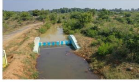
Cement concrete check dam@vellaputhur to karikkili supply channel