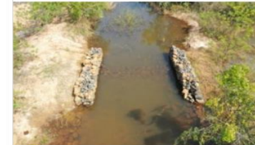
Gabion check dam @ vellaputhur to Karikkili supply channel