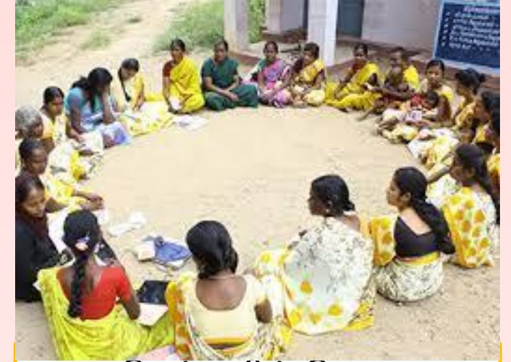
ஏழை பெண்களின் பொருளாதார மேம்பாடு வளர செய்தல்