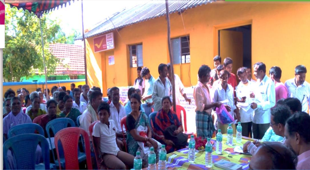
கடனுதவி வழங்க வங்கியில் முகாம்கள்