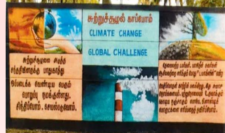
சமூக செய்திகளை சுவரில் எழுத்து மூலம் விளம்பரம் செய்தல்

மக்கள் வெளியிடங்களில் மலம் கழிப்பது தவறு என்பது குறித்த விழிப்புணர்வு முகாம்கள்