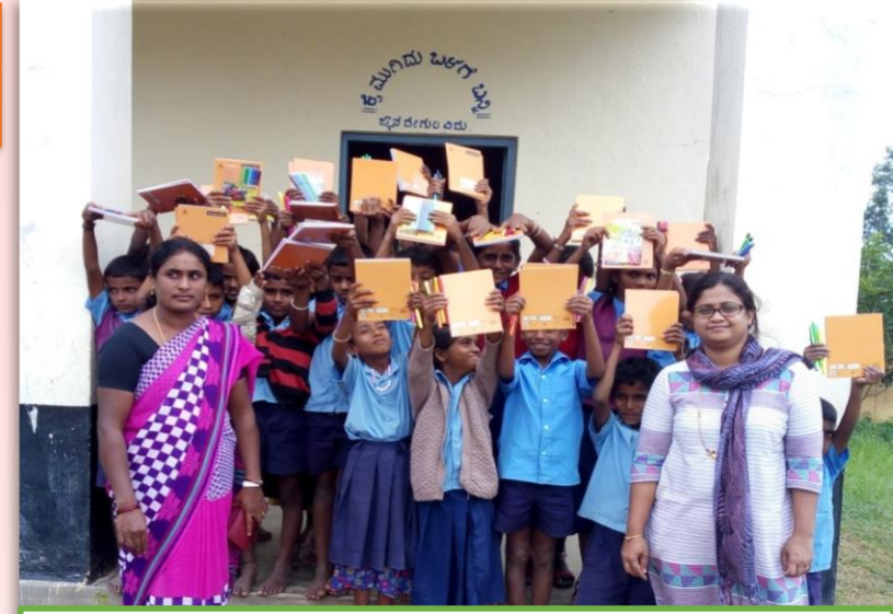
மாணவர்களுக்கு இலவசமான புத்தகங்களை வழங்குதல்