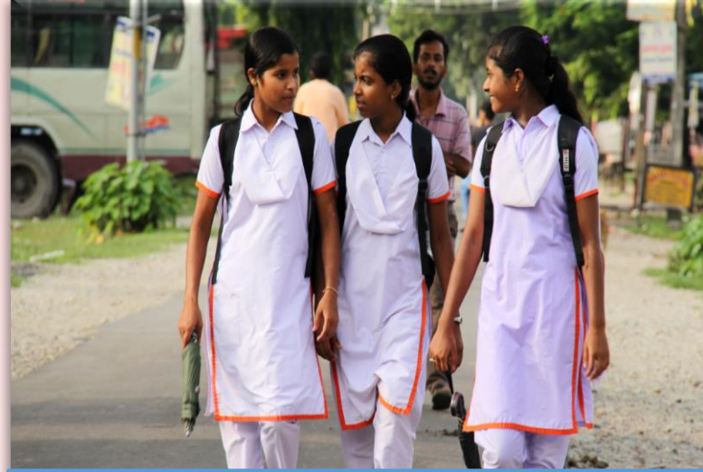
ஆரம்ப மற்றும் மேனிலை படிப்பை பெண் குழந்தைகளுக்கு உறுதி செய்தல்