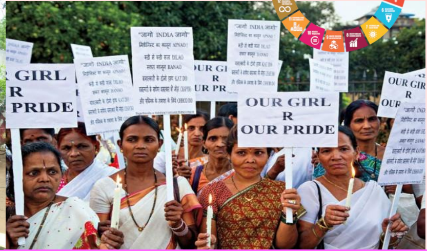
பாதுகாப்பான சுழலை உறுதி செய்தல்