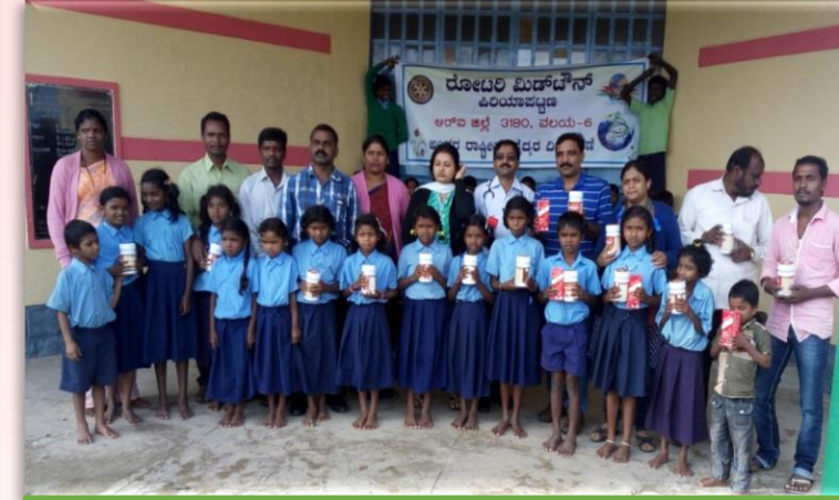
குழந்தைகளுக்கான ஊட்டச்சத்துகளை வழங்குதல்