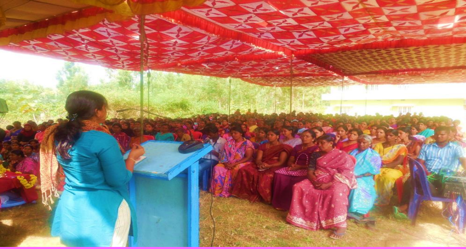
கிராம ஊராட்சி யில் பெண்கள்