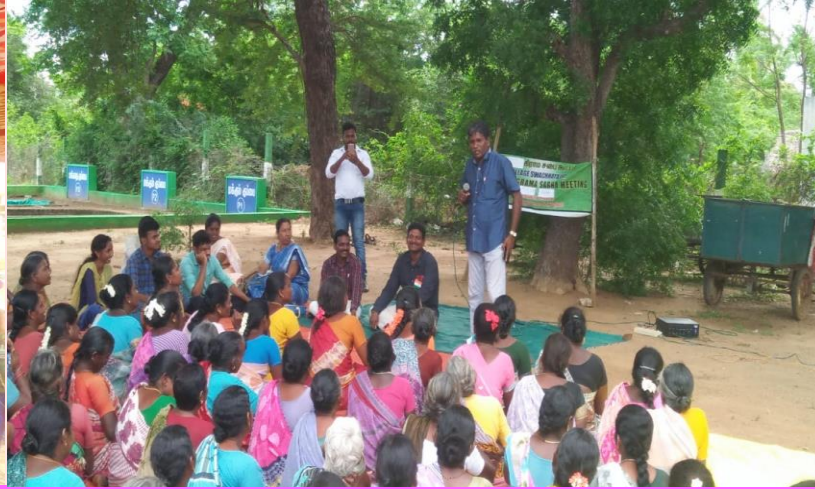
கிராமசபையில் பெண்கள் பங்கேற்பு