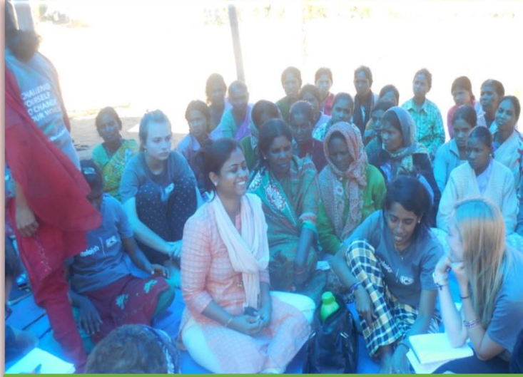
பெண்கள்/குழந்தைகள் முன்மாற்றத்திற்கான பல்வேறு விழிப்புணர்வு முகாம்கள் அமைத்தல்