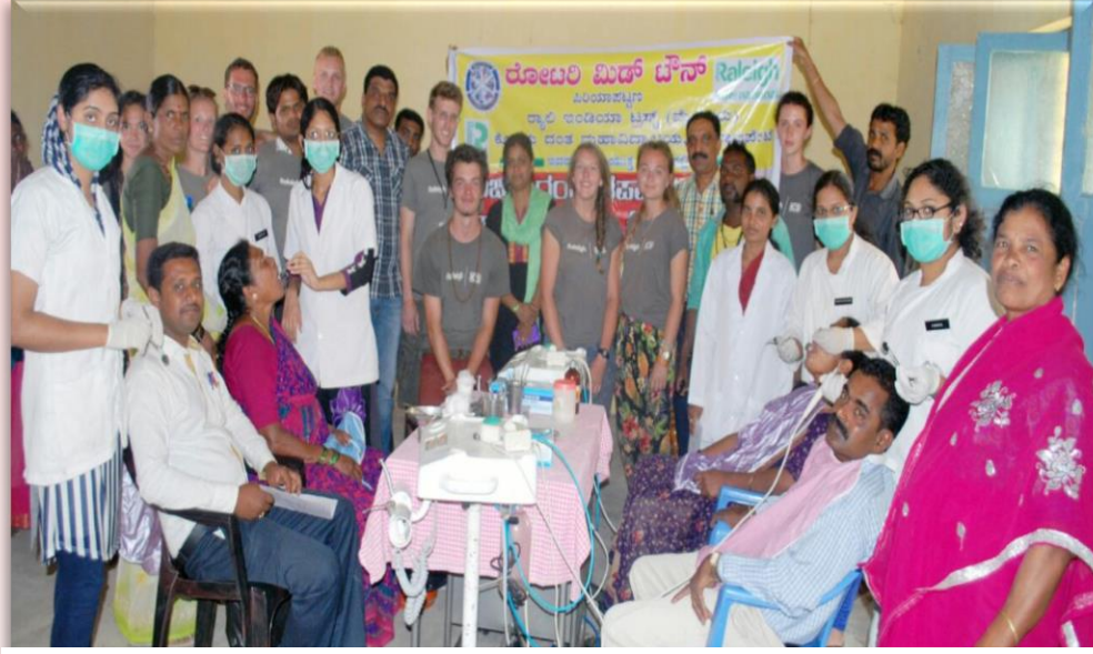
இலவச சுகாதார முகாம்கள்