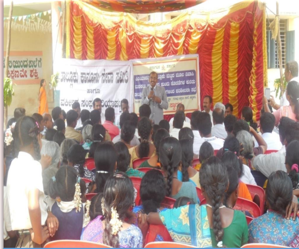
பெண்களுக்கு சட்ட ரீதியான விழிப்புணர்வு முகாம் அமைத்தல்