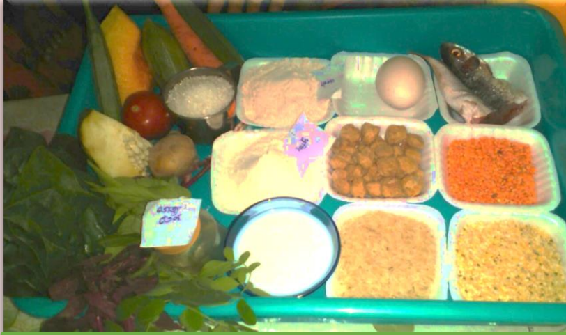
பெண் குழந்தைகளின் ஊட்டச்சத்து உணவினை உறுதிசெய்தல்