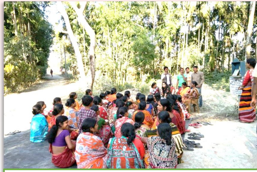
கிராம கூட்டங்கள் நடத்துதல்