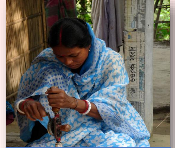
பெண்களுக்கான தரமான தொழில் நுட்ப கல்வியில் சமமான வாய்ப்பினை உறுதி செய்தல்.