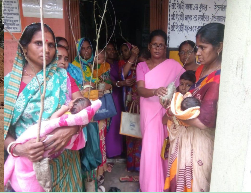
బిడ్డ పేరుమీదుగా మొక్కల పంపణి