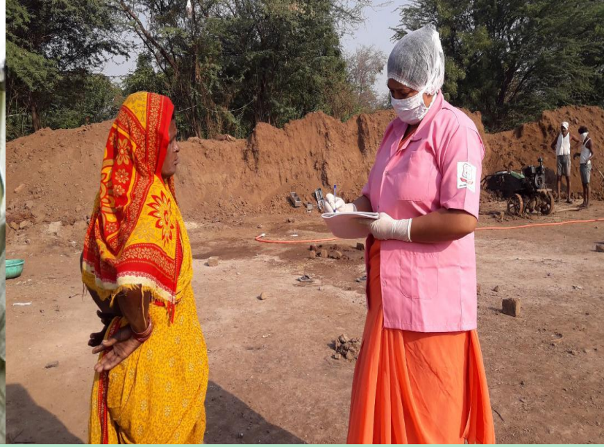
సకాలం లో వ్యాధి గుర్తింపు, నివారణ అవగాహన