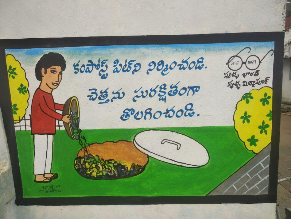
ముందస్తు చర్యలతో గోడ రాతలు