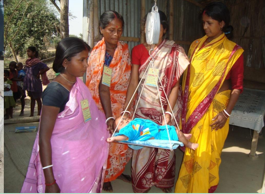
హేల్త్ బేబీ షోస్