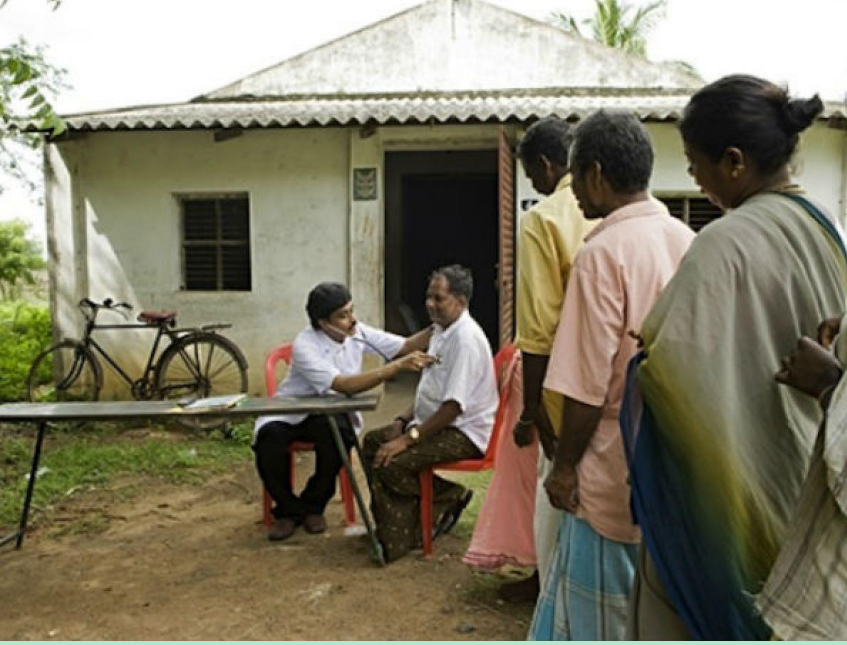
ఆరోగ్య సదస్సు నిర్వహణ