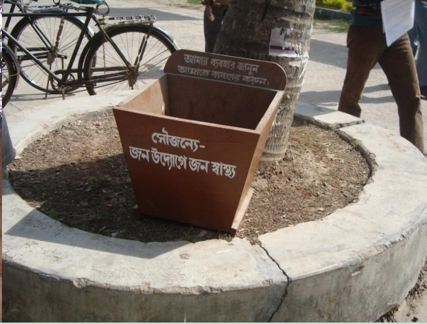
సమాజం లో పరిశుభ్రత పాటించడం