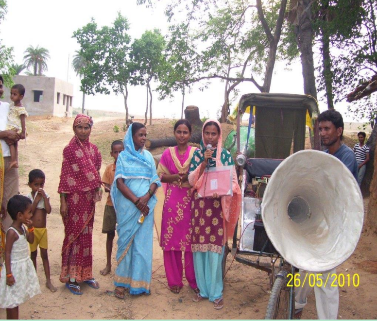
మైకు ద్వారా ప్రచారం