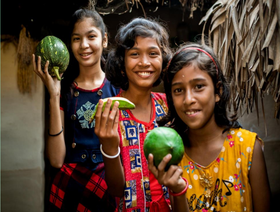
కౌమార ఆరోగ్యం పై టాక్ షోస్ ,చర్చలు