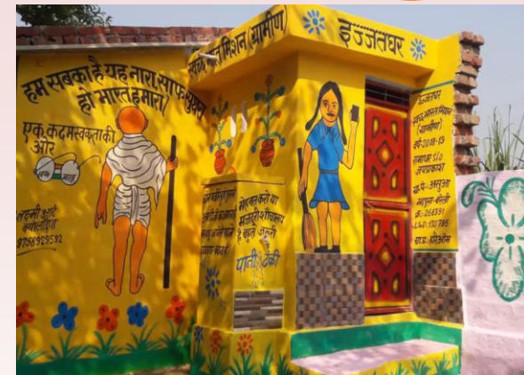
ব্যক্তিগত ঘৰুৱা পায়খানা