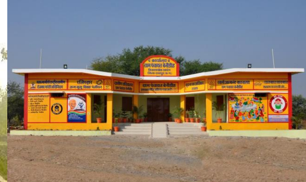
গাঁও পঞ্চায়ত ভবন