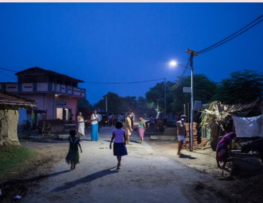
স্ট্রীট লাইটৰ ব্যৱস্থা