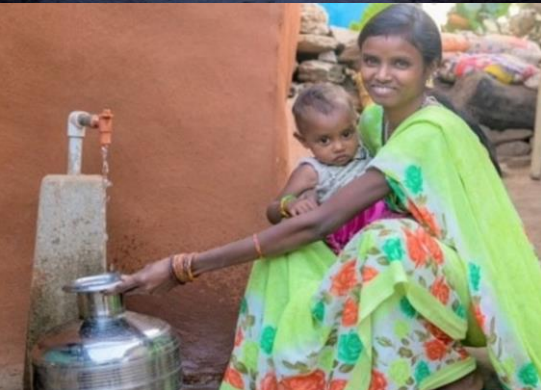
কাৰ্যক্ষম ঘৰুৱা পানীৰ নল সংযোগ