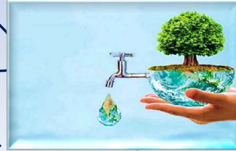
বাড়ি বাড়ি শৌচাগারের ব্যবহার