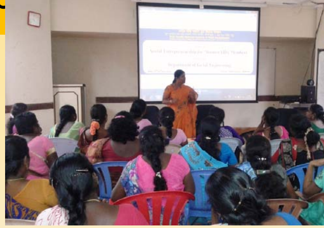
વિવિધ સામાજિક સુરક્ષા યોજનાઓ અંગે જાગૃતિ અભિયાન