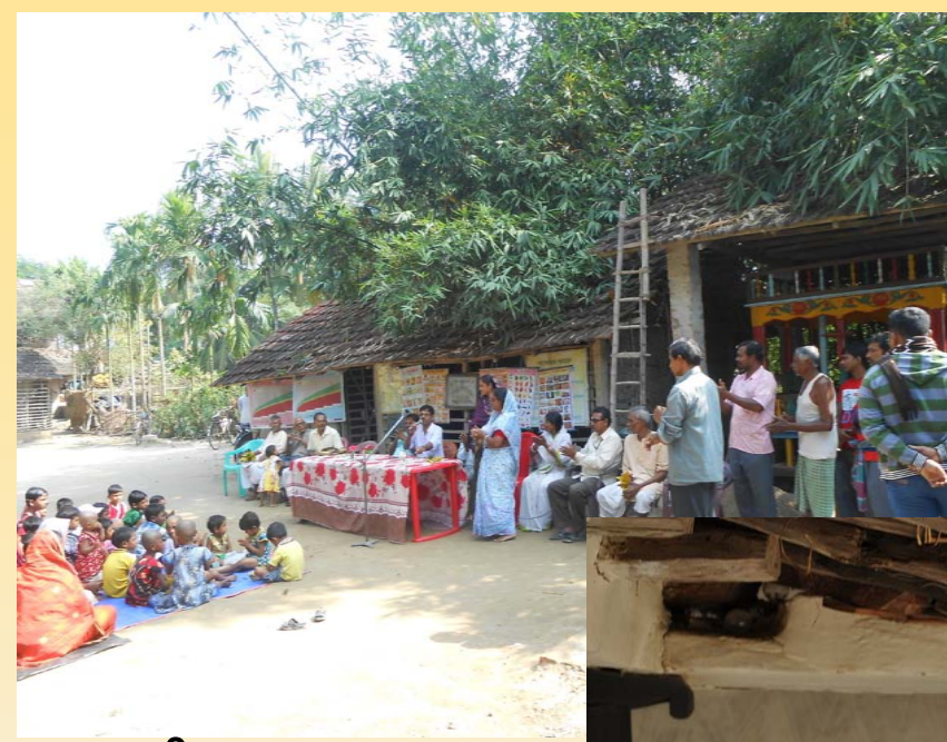
ગ્રામીણ શાસનના અસરકારક વિકેન્દ્રીકરણ માટે ગ્રામસભાનું આયોજન કરો