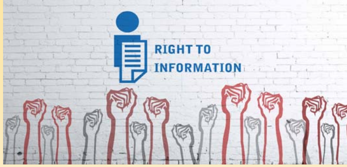
પારદર્શિતા માટે માહિતીની સક્રિય જાહેરાત