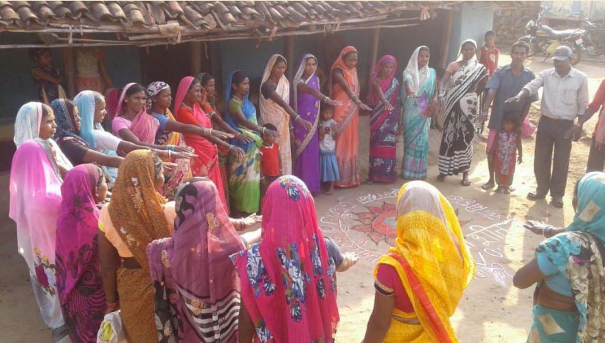
લાભો તમામ સંવેદનશીલ સુધી પહોંચે તેની ખાતરી કરવી