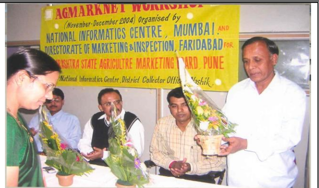
Inauguration of workshop at NIC Nashik