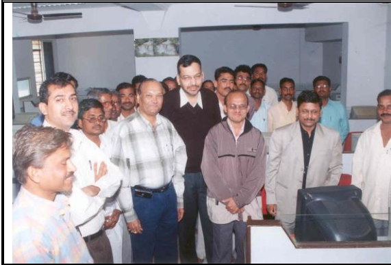
SIO with participants at NIC Yavatmal