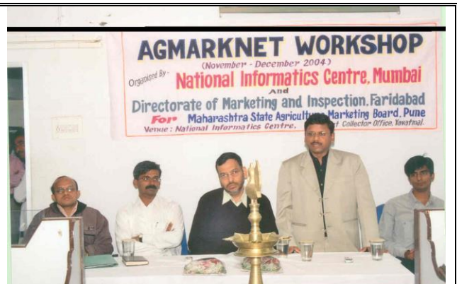
Collector Yavatmal delivering speech at NIC Yavatmal