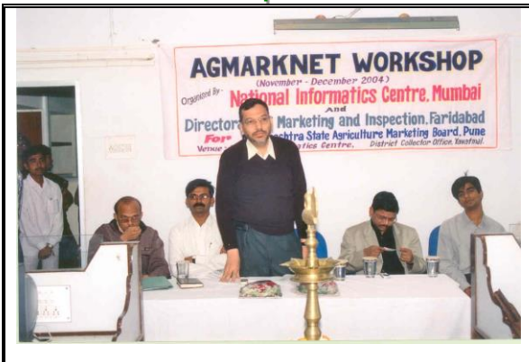
SIO Maharashtra delivering speech at NIC Yavatmal