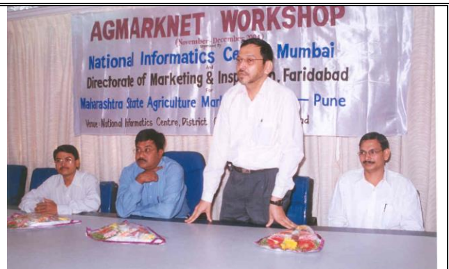
SIO delivering speech at NIC Raigad