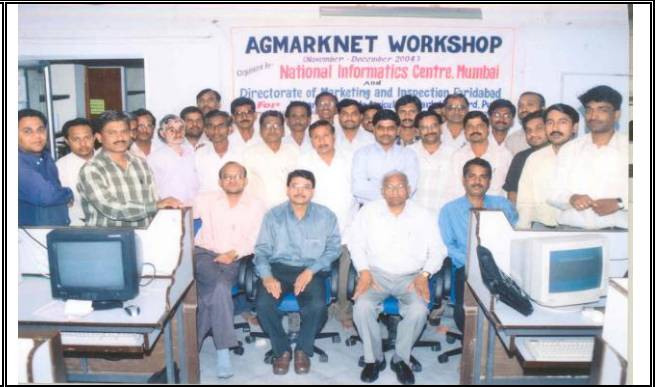
All Participants of workshop at NIC Yavatmal