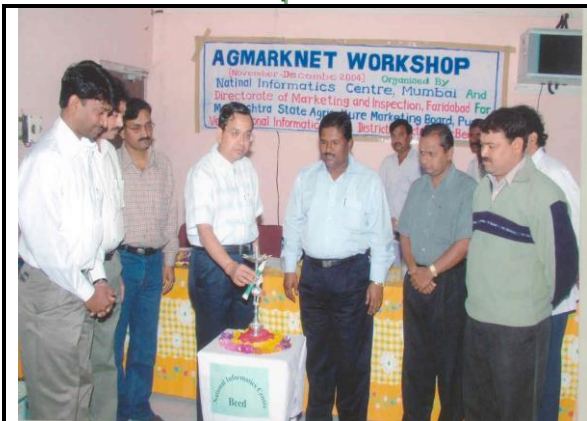
Inauguration of workshop at NIC Beed