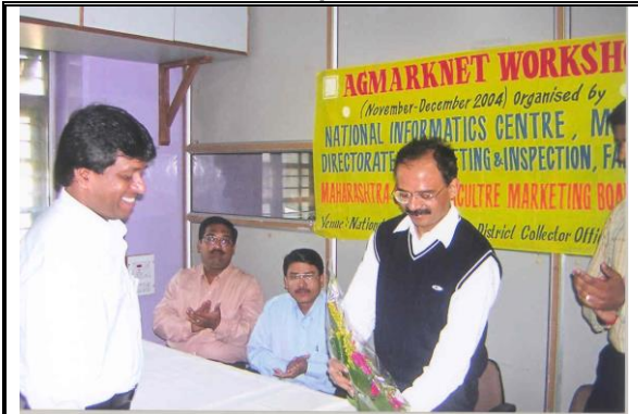
Inauguration of workshop at NIC Nashik