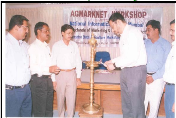
SIO Maharashtra inaugurating workshop at Raigad