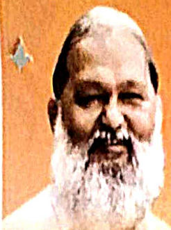
Anil Vij Hon'ble Health Minister Haryana