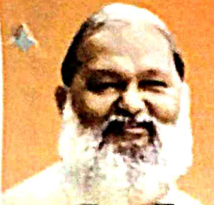
अनिल विज माननीय स्वास्थ्य मंत्री हरियाणा