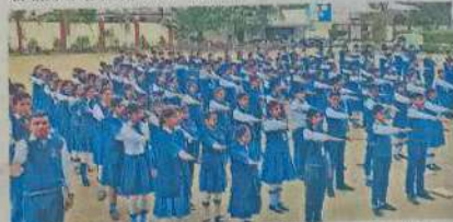
यमुनानगर | संविधान दिवस पर शपथ लेते नेशनल स्कूल के विद्यार्थी।