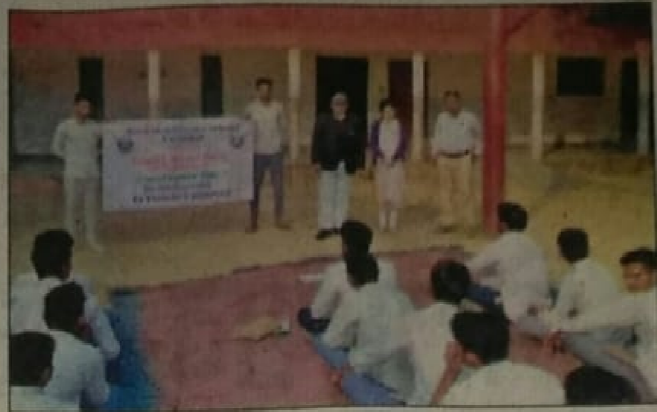
बच्चों को जानकारी देते अधिवक्ता