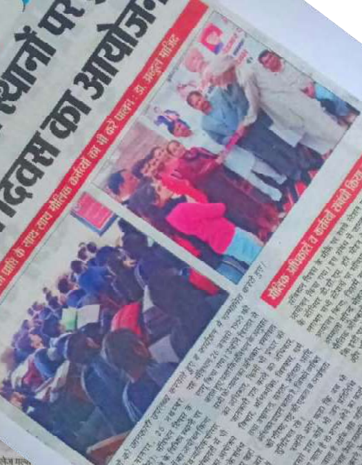
शपथ और शपथ लेते नेशनल स्कूल के विद्यार्थी

आयोजकों की प्रती के साथ साथ अधिकारियों पर भी हुए शपथ, डॉ. भीमराव अंबेडकर