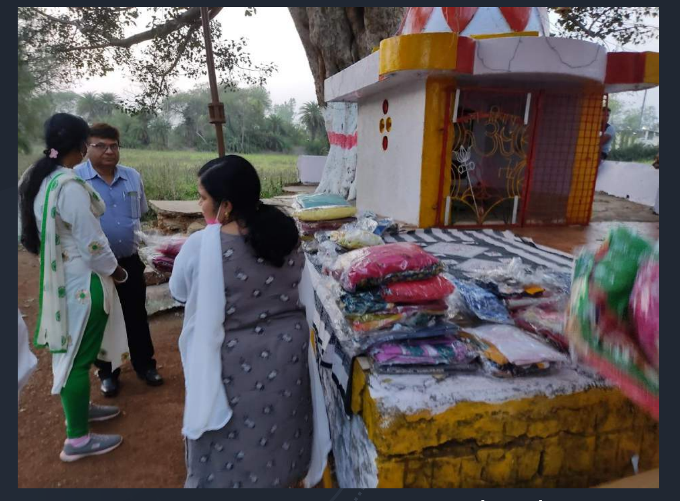
Team arranging clothes – Gents / Ladies / Children wise