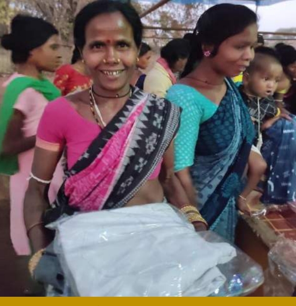
Be the reason someone smiles, feels loved, believes in goodness of people....