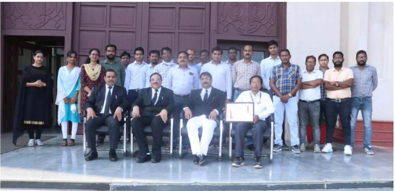
The proud team of High Court with the Award

Under the able leadership of Hon'ble the Acting Chief Justice and Guidance of Hon'ble Chairman of Computerization Committee N-Step, ICJS, ePayment, eFiling, Virtual Court is implemented successfully. During covid-19 pandemic lock down Virtual courts were running successfully. Now the Hybrid court having facility of virtual and physical hearing is running in High Court. Latest version of CIS is installed in High Court.